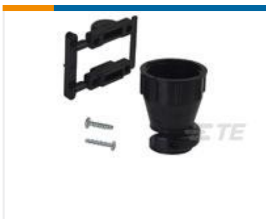
TE 产品编号206070-8 CABLE CLAMP KIT #17