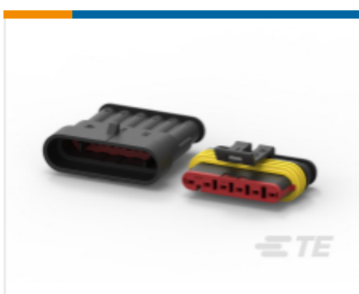
TE 产品编号282104-1 AMP SUPERSEAL 1.5MM, 连接器壳体