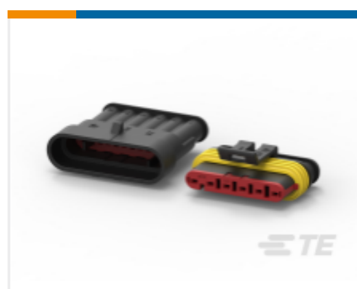
TE 产品编号282104-1 AMP SUPERSEAL 1.5MM 连接器壳体