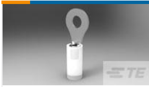
TE 产品编号323986 TERMINAL,PIDG R 24-20 6