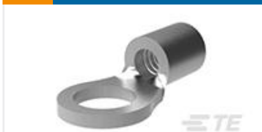
TE 产品编号34111 SOLIS R 22-16 COMM 22-18 MIL 8