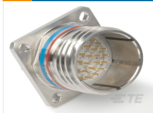
TE 产品编号YDTS20F25-24PAV001 D38999 : 方形凸缘, 25-24 插件