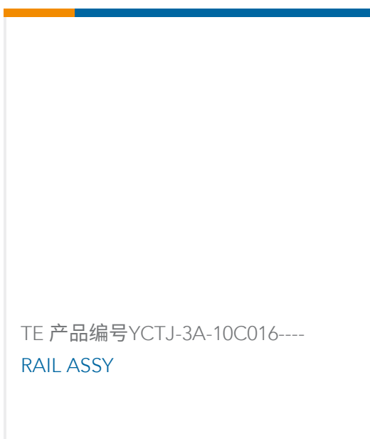
TE 产品编号YCTJ-3A-10C016 RAIL ASSY