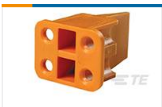
TE 产品编号WP-4S WEDGE LOCK, 4P, PLG, ORG, DTP