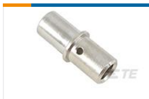
TE 产品编号0462-203-04141 SOC, SOLID, SIZE 4, 6AWG, NI