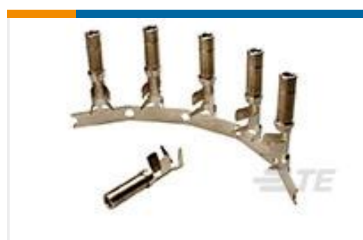
TE 产品编号1062-12-0222 SOC, SF, SIZE 12, 10, NI/NI