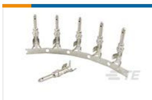
TE 产品编号1060-12-0222 PIN, SF, SIZE 12, 10, NI/NI