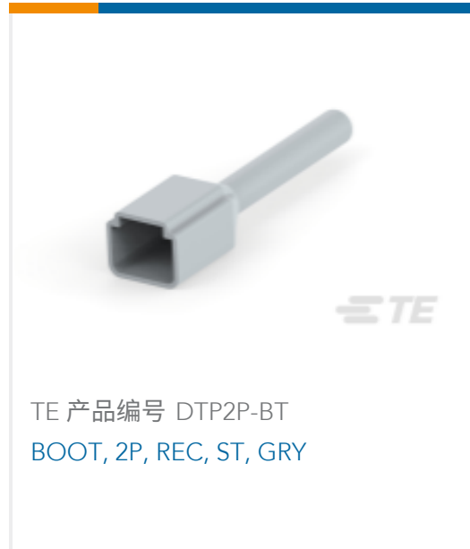
TE 产品编号 DTP2P-BT BOOT, 2P, REC, ST, GRY