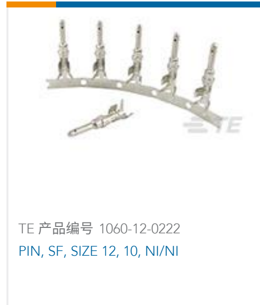
TE 产品编号 1060-12-0222 PIN, SF, SIZE 12, 10, NI/NI