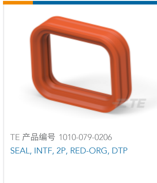
TE 产品编号 1010-079-0206 SEAL, INTF, 2P, RED-ORG, DTP