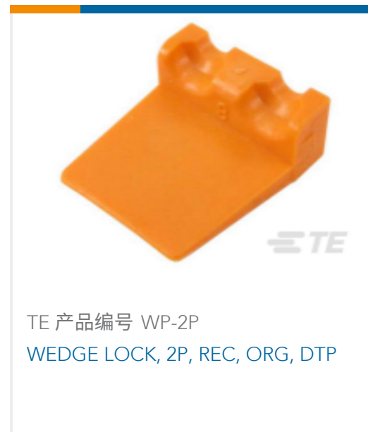
TE 产品编号 WP-2P WEDGE LOCK, 2P, REC, ORG, DTP