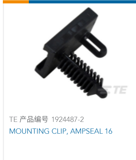
TE 产品编号 1924487-2 MOUNTING CLIP, AMPSEAL 16