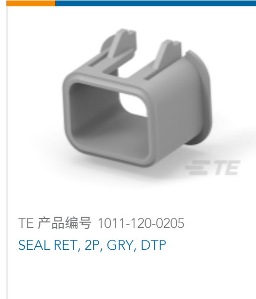
TE 产品编号 1011-120-0205 SEAL RET, 2P, GRY, DTP