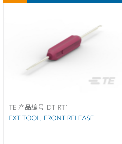
TE 产品编号 DT-RT1 EXT TOOL, FRONT RELEASE