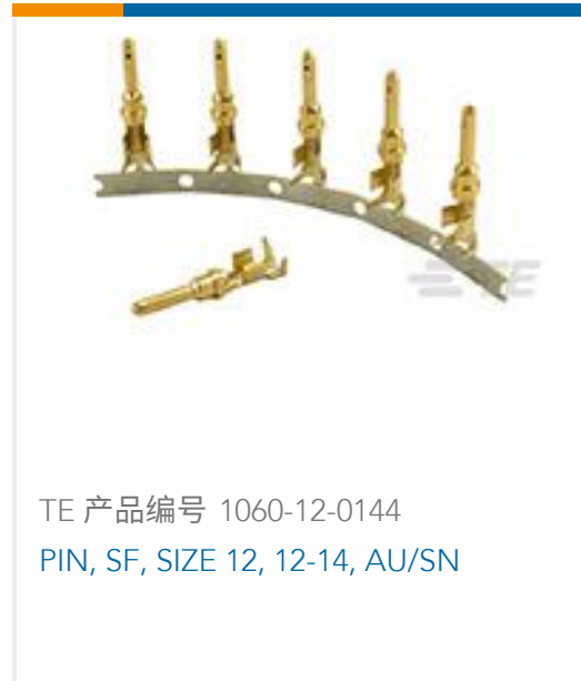
TE 产品编号 1060-12-0144 PIN, SF, SIZE 12, 12-14, AU/SN