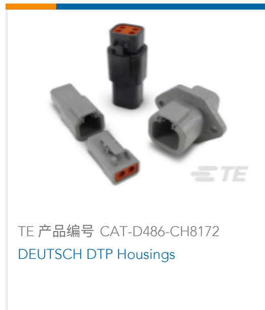
TE 产品编号 CAT-D486-CH8172 DEUTSCH DTP Housings