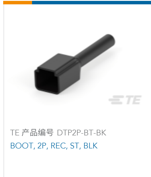
TE 产品编号 DTP2P-BT-BK BOOT, 2P, REC, ST, BLK