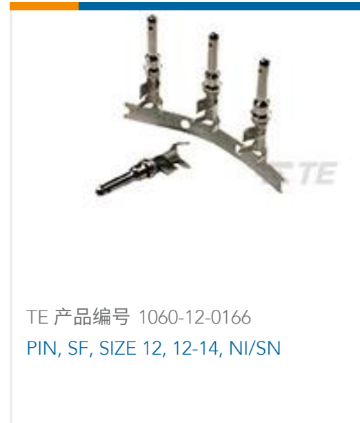
TE 产品编号 1060-12-0166 PIN, SF, SIZE 12, 12-14, NI/SN