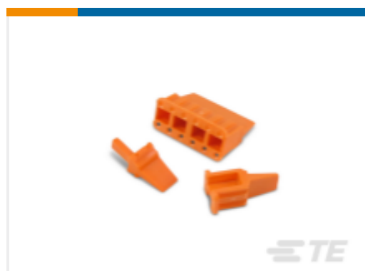
TE 产品编号WM-3S DEUTSCH DTM Wedgelocks