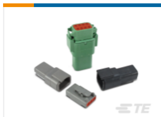
TE 产品编号DTM06-08SA DEUTSCH DTM Housings