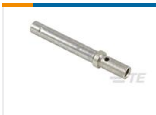
TE 产品编号0462-201-20141 SOC, SOLID, SIZE 20, 20AWG, NI