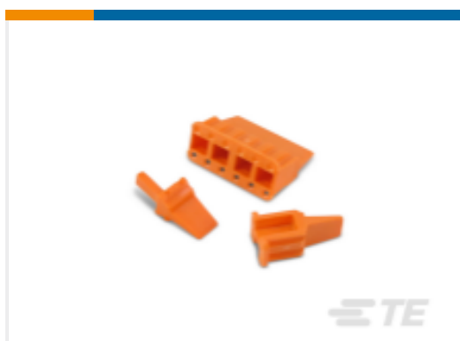
TE 产品编号WM-6P DEUTSCH DTM Wedgelocks