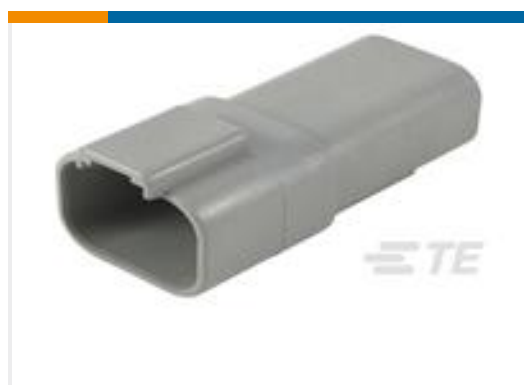
TE 产品编号DT04-4P REC, 4P, GRY, N