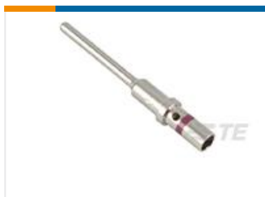
TE 产品编号0460-010-20141 PIN, SOLID, SIZE 20, 16-18AWG, NI