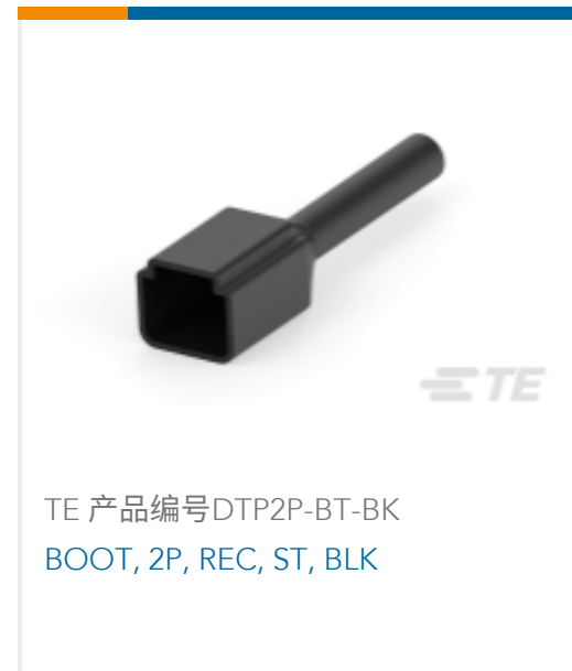
TE 产品编号DTP2P-BT-BK BOOT, 2P, REC, ST, BLK