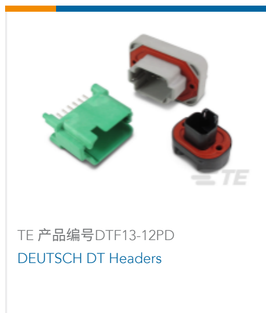
TE 产品编号DTF13-12PD DEUTSCH DT Headers