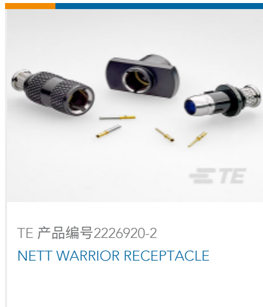
TE 产品编号2226920-2 NETT WARRIOR RECEPTACLE