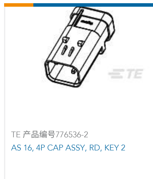
TE 产品编号776536-2 AS 16, 4P CAP ASSY, RD, KEY 2