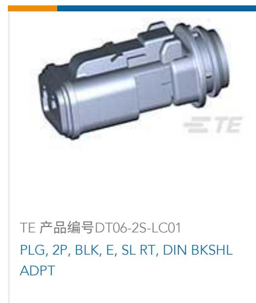
TE 产品编号DT06-2S-LC01 PLG, 2P, BLK, E, SL RT, DIN BKSHL ADPT