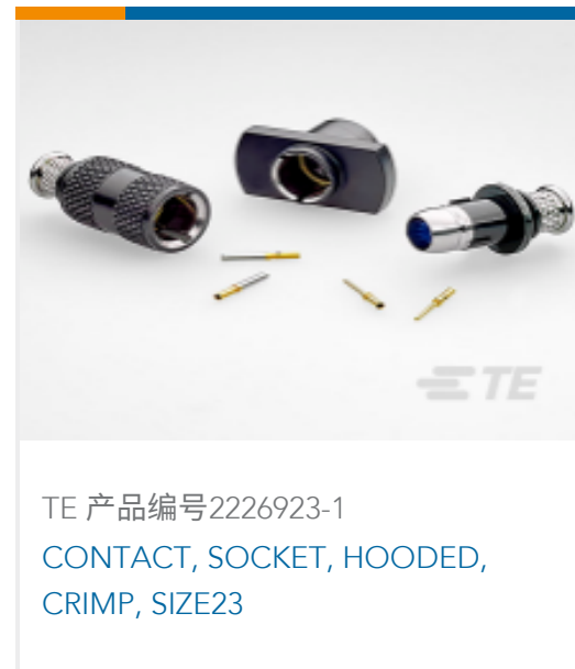
TE 产品编号2226923-1 CONTACT, SOCKET, HOODED, CRIMP, SIZE23