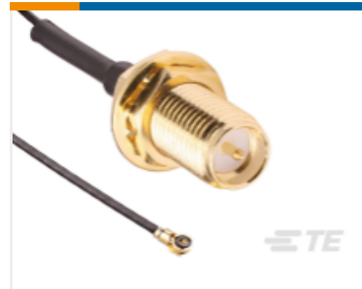
TE 产品编号CSJ-RGFB-200-MHF4 RP-SMA to MHF4 200mm 0.81 OD