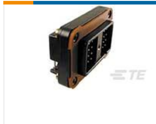
TE 产品编号DRC13-24PA HDR, 24P, BLK, RA, 1032 FLG, SN/NI /CU, A