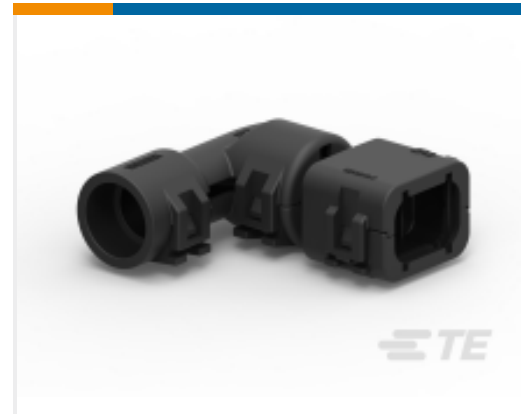
TE 产品编号2302481-2 PIN CONN CVRASSY,2POS, AMPSEAL16,90DEG,MC