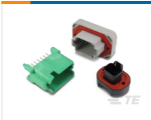
TE 产品编号DT15-2P DEUTSCH DT Headers