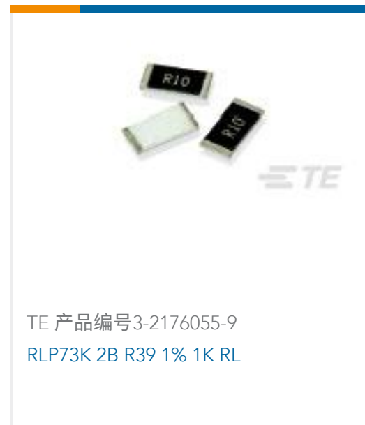
TE 产品编号3-2176055-9 RLP73K 2B R39 1% 1K RL