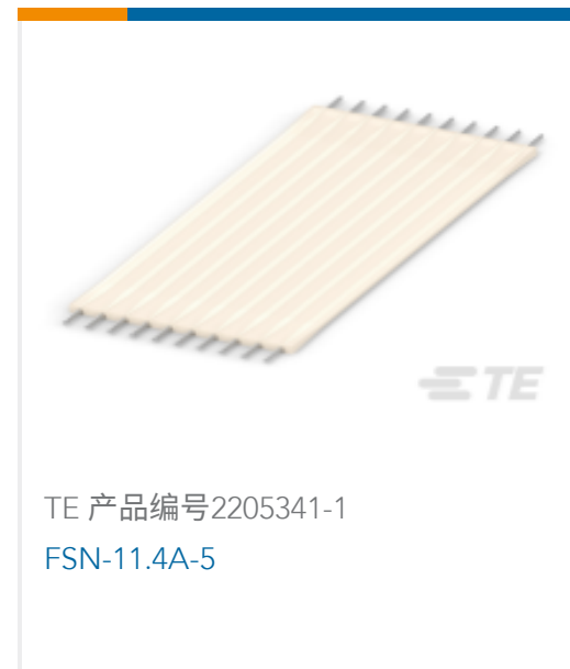
TE 产品编号2205341-1 FSN-11.4A-5