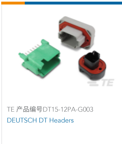
TE 产品编号DT15-12PA-G003 DEUTSCH DT Headers