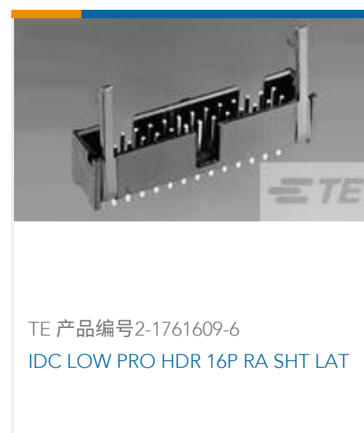
TE 产品编号2-1761609-6 IDC LOW PRO HDR 16P RA SHT LAT