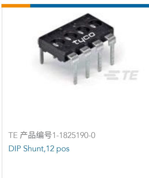
TE 产品编号1-1825190-0 DIP Shunt, 12 pos