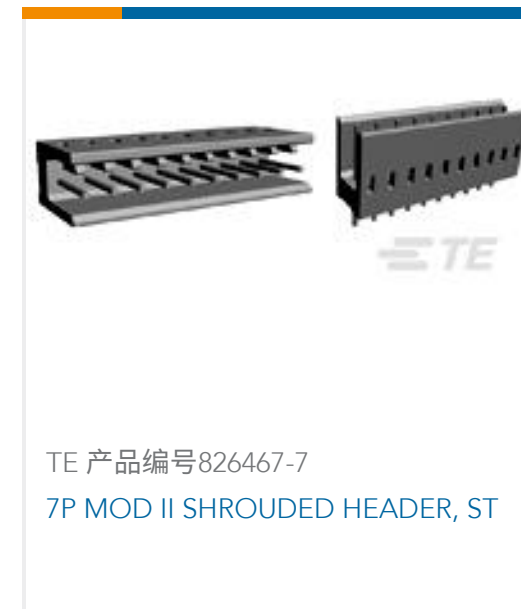
TE 产品编号826467-7 7P MOD II SHROUDED HEADER, ST