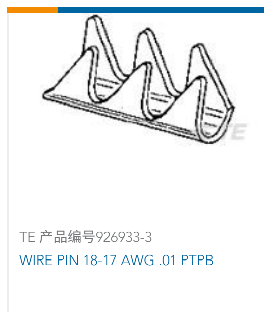
TE 产品编号926933-3 WIRE PIN 18-17 AWG .01 PTPB