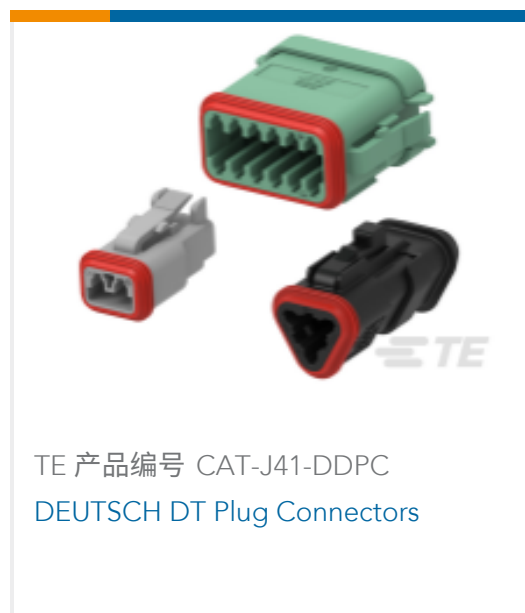
TE 产品编号 CAT-J41-DDPC DEUTSCH DT Plug Connectors