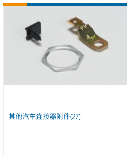
其他汽车连接器附件(27)