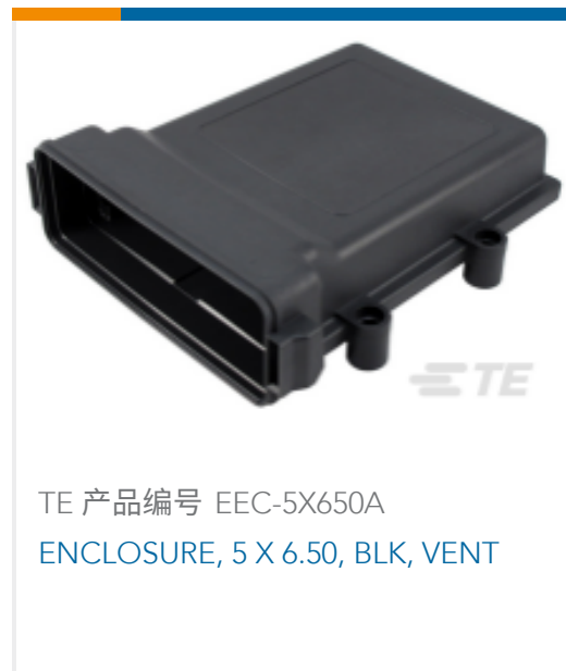
TE 产品编号 EEC-5X650A ENCLOSURE, 5 X 6.50, BLK, VENT