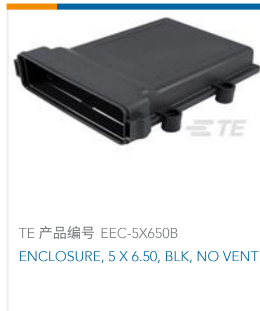
TE 产品编号 EEC-5X650B ENCLOSURE, 5 X 6.50, BLK, NO VENT