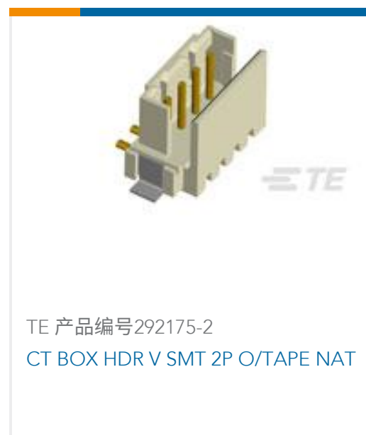
TE 产品编号292175-2 CT BOX HDR V SMT 2P O/TAPE NAT