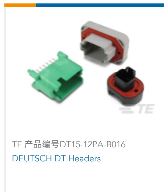
TE 产品编号DT15-12PA-B016 DEUTSCH DT Headers