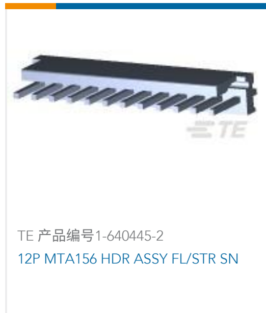
TE 产品编号1-640445-2 12P MTA156 HDR ASSY FL/STR SN