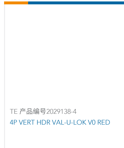
TE 产品编号2029138-4 4P VERT HDR VAL-U-LOK V0 RED