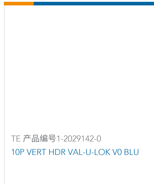
TE 产品编号1-2029142-0 10P VERT HDR VAL-U-LOK V0 BLU