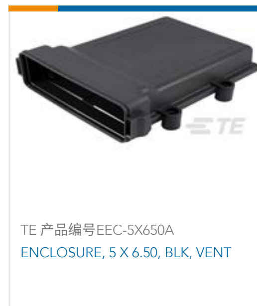
TE 产品编号EEC-5X650A ENCLOSURE, 5 X 6.50, BLK, VENT