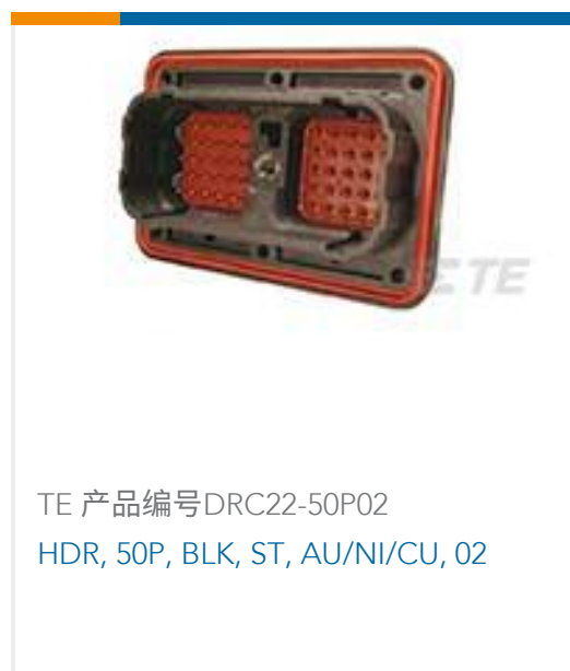
TE 产品编号DRC22-50P02 HDR, 50P, BLK, ST, AU/NI/CU, 02