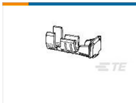
TE 产品编号1-150504-2 BUTTON CONTACT 20-16 .0158 X .625 TPBR