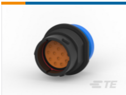
TE 产品编号HDP24-18-14PE-L017 REC, 14P, BLK, E, RNG, 16, P