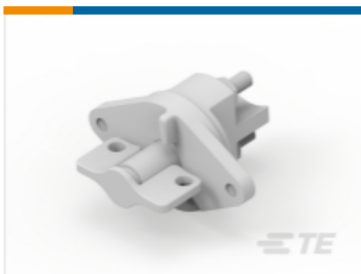
TE 产品编号K1161854 Battery Disconnecter 35-414-130-R-902