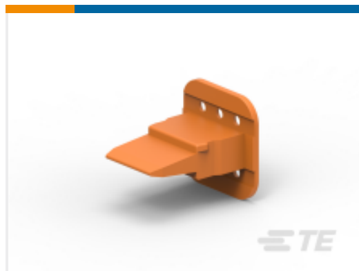
TE 产品编号W6S WEDGE LOCK, 6P, PLG, ORG, STD, DT