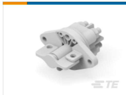
TE 产品编号K1161213 Battery Disconnecter 35-224-130-R-900