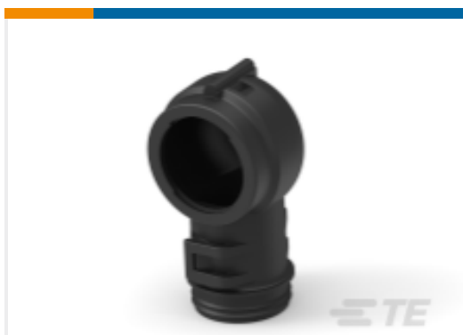
TE 产品编号SMBR-01-U DIN72585 BACKSHELL 90 strain relief