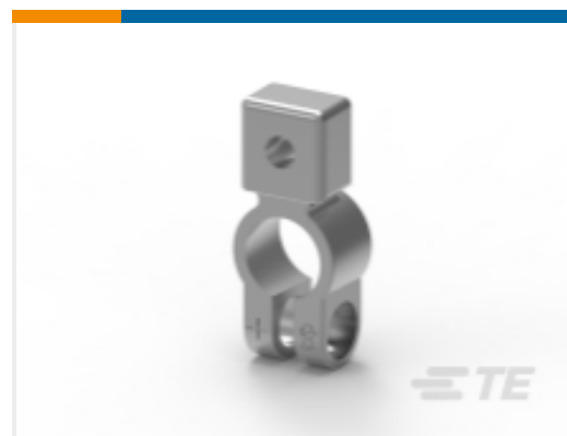
TE 产品编号HC5899 BAT CONNECTOR POS8MM AUXILLARY MNT