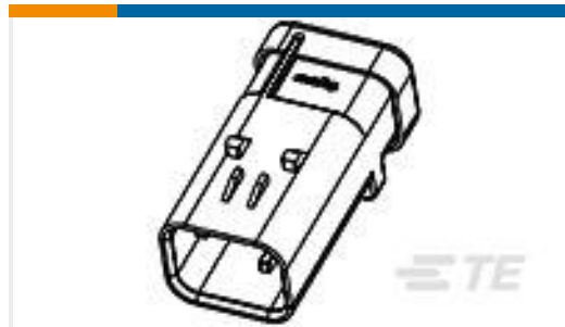
TE 产品编号776536-2 AS 16, 4P CAP ASSY, RD, KEY 2