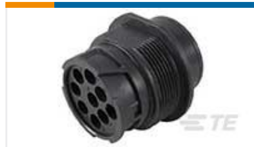
TE 产品编号HD10-9-96PE-B025 RECP ASM