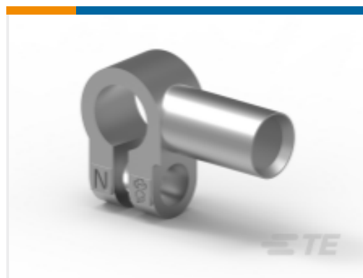
TE 产品编号HC5841 70MM2 BATTERY CLMP ASSMB NEGATIVE