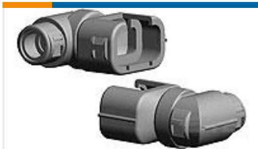
TE 产品编号2035366-7 Backshell,AS16,4P,90Deg,NC08,LP, Plug