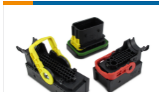
TE 产品编号2-2112162-1 LEAVYSEAL Housings