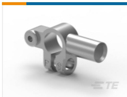
TE 产品编号HC5840D INTEGRAL BATT. POST. DOUBLE TAPER.