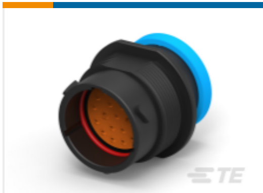
TE 产品编号HDP24-18-20PE-L017 REC, 20P, BLK, E, RNG, 16/20, P