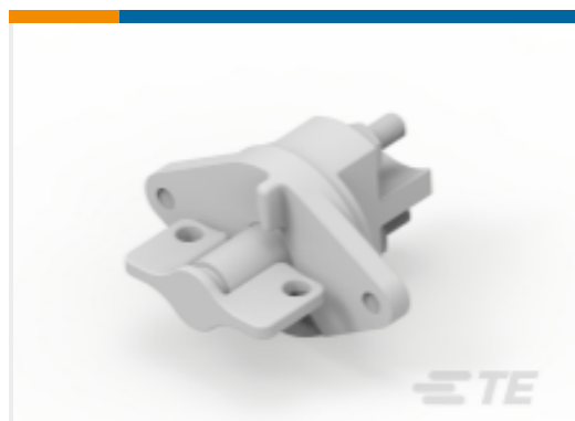
TE 产品编号K1161854 Battery Disconnecter 35-414-130-R-902