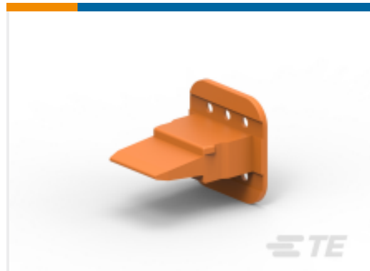
TE 产品编号W6S WEDGE LOCK, 6P, PLG, ORG, STD, DT