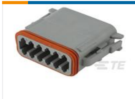
TE 产品编号DT06-12SA-C015 PLG, 12P, GRY, E, A