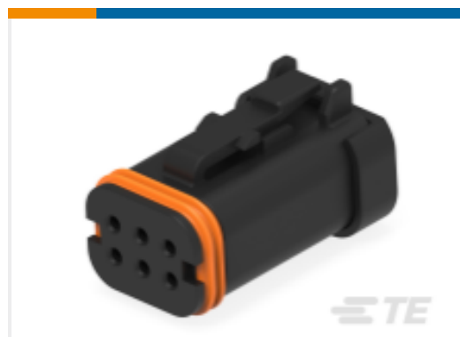
TE 产品编号DT16-6SB-KP01 PLG, 6P, BLK, E, B