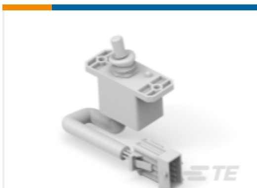
TE 产品编号K1128842 Toggle Switch 07-1-2-74 900