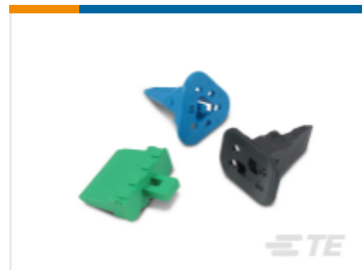
TE 产品编号W12S Wedgelocks: DEUTSCH DT