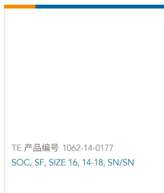
TE 产品编号 1062-14-0177 SOC, SF, SIZE 16, 14-18, SN/SN