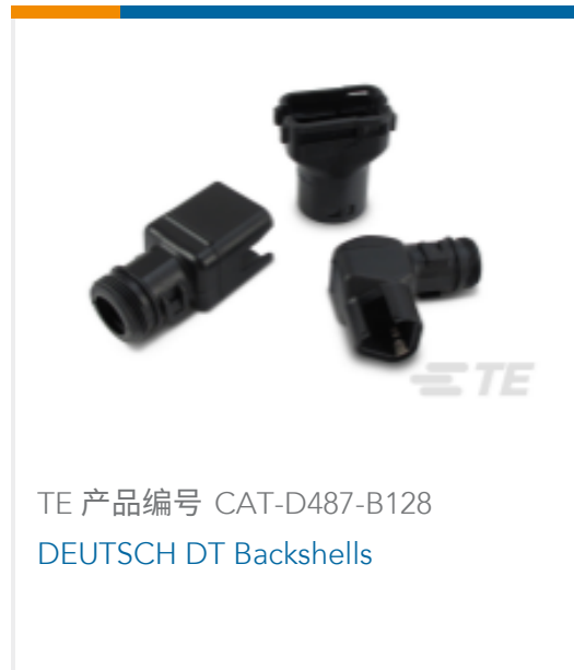
TE 产品编号 CAT-D487-B128 DEUTSCH DT Backshells