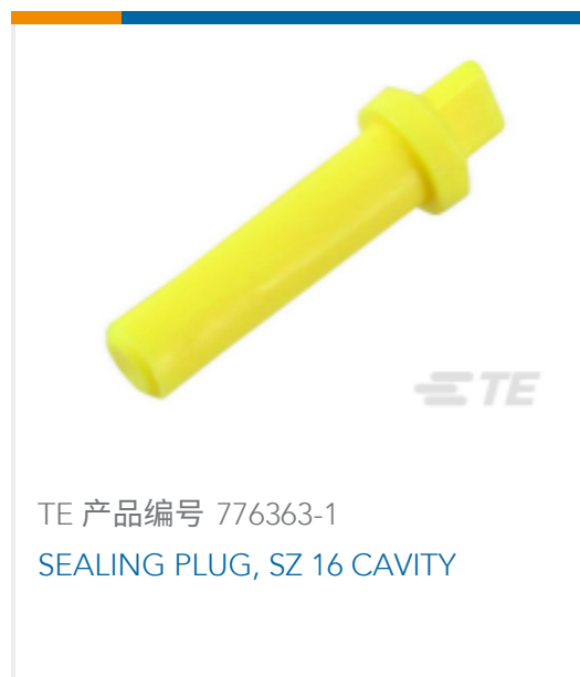
TE 产品编号 776363-1 SEALING PLUG, SZ 16 CAVITY