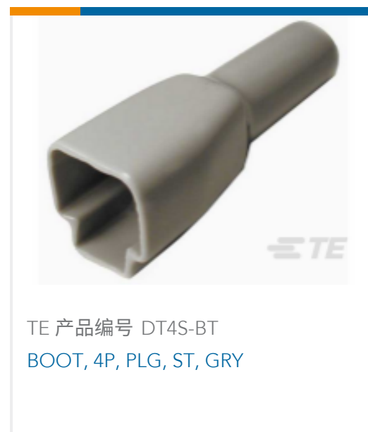
TE 产品编号 DT4S-BT BOOT, 4P, PLG, ST, GRY