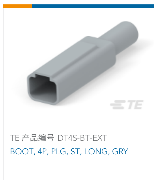
TE 产品编号 DT4S-BT-EXT BOOT, 4P, PLG, ST, LONG, GRY