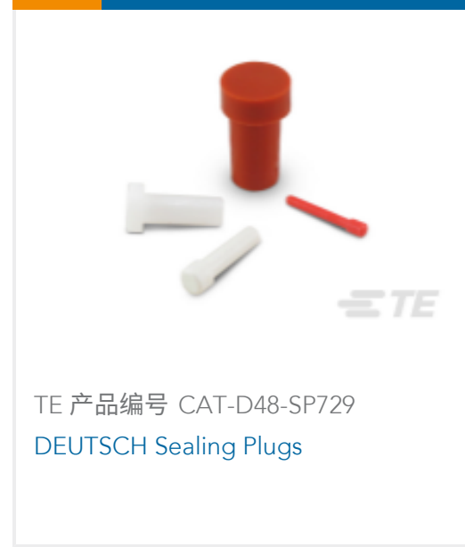
TE 产品编号 CAT-D48-SF729 DEUTSCH Sealing Plugs