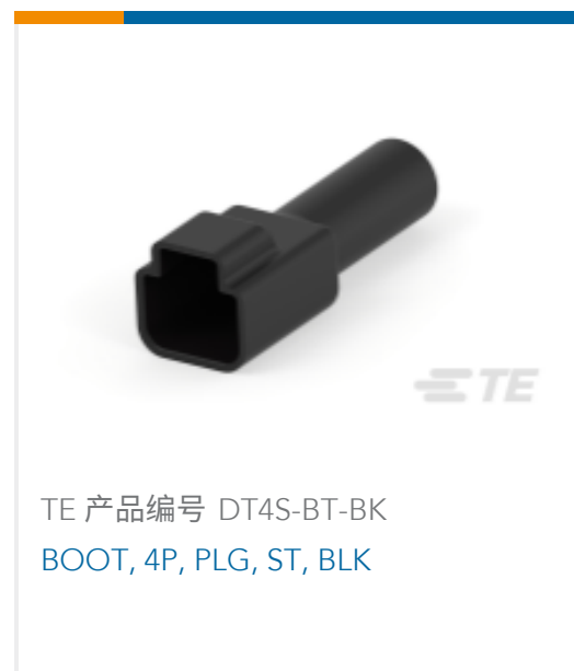
TE 产品编号 DT4S-BT-BK BOOT, 4P, PLG, ST, BLK