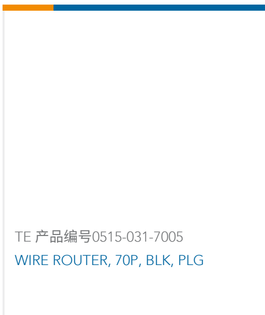
TE 产品编号0515-031-7005 WIRE ROUTER, 70P, BLK, PLG