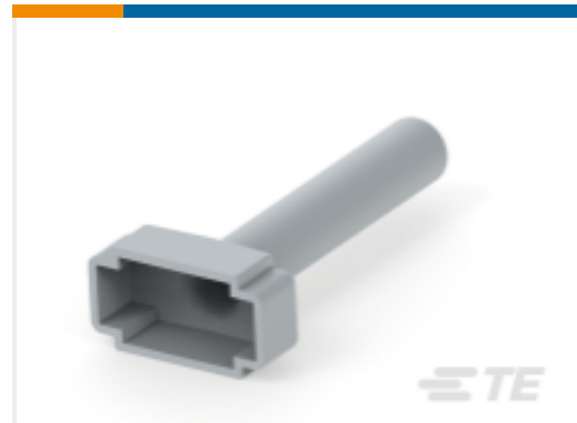
TE 产品编号DTM8S-BT BOOT, 8P, PLG, ST, GRY