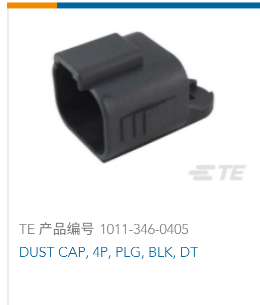
TE 产品编号 1011-346-0405 DUST CAP, 4P, PLG, BLK, DT