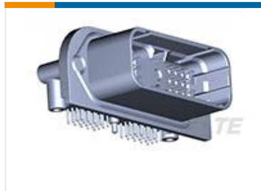
TE 产品编号DRC23-40PB-N012 HDR, 40P, BLK, RA, AU/NI/CU, B