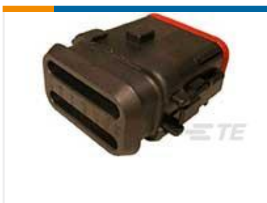
TE 产品编号DT06-12SA-CE12 PLG, 12P, BLK, E,SEAL RET,ENH KEY, XCAP,A