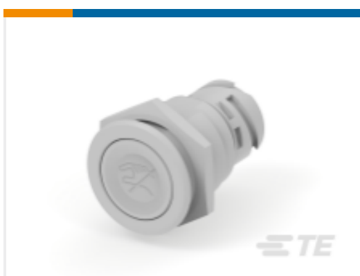
TE 产品编号K1151130 Leuchtmelder TS-201-WS102