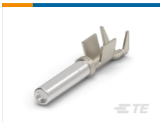
TE 产品编号1062-16-1244 SOC, SF, SIZE 16, 12-16, AU/SN