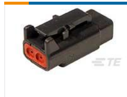
TE 产品编号DTM06-2S-E004 PLG, 2P, BLK, N