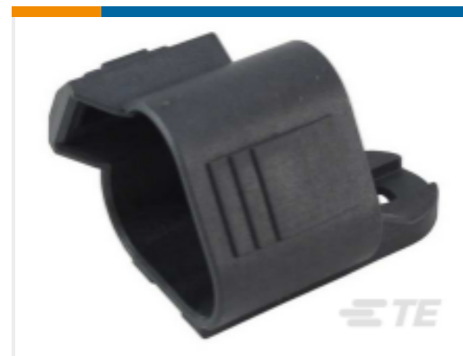
TE 产品编号1011-345-0305 DUST CAP, 3P, PLG, BLK, DT