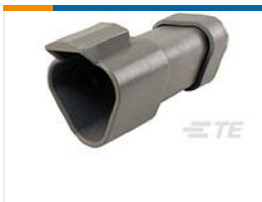
TE 产品编号DT04-3P-E003 REC, 3P, GRY, N, CAP