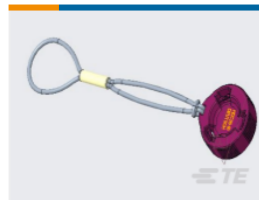
TE 产品编号HDC26-18-JDL COVER HDP 18 SHL RC RUBBER LYD