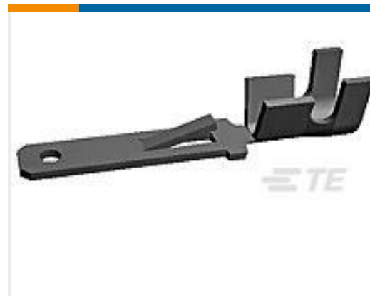
TE 产品编号160859-4 FF 250 TAB 20-17 AWG .016 TPPB