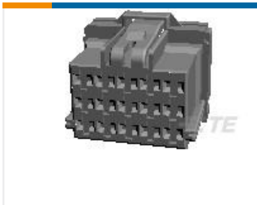
TE 产品编号6-968973-1 MCP2.8 GEH ASSY 15P