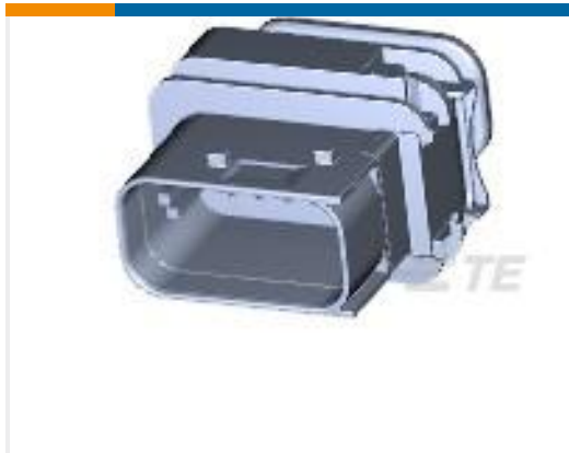
TE 产品编号2-1564414-1 12POS,TAB 1.6X0.6,TAB HSG,ASSY