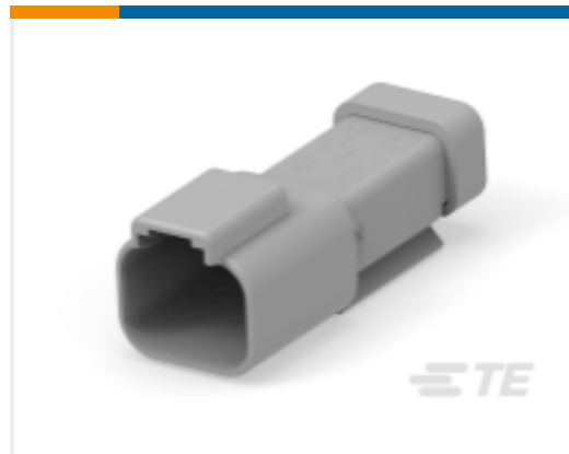
TE 产品编号YDT04-2P-P06000000 REC, 2P, BLK, BUSBAR, NI