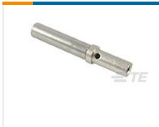
TE 产品编号0462-201-16141 SOC, SOLID, SIZE 16, 16-20AWG, NI