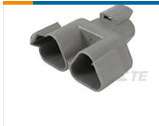
TE 产品编号DT04-3P-P007 REC, 3P, GRY, Y-SPLITTER