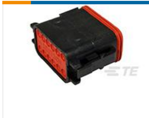
TE 产品编号DT06-12SB PLG, 12P, BLK, N, B