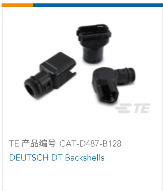
TE 产品编号 CAT-D487-B128 DEUTSCH DT Backshells