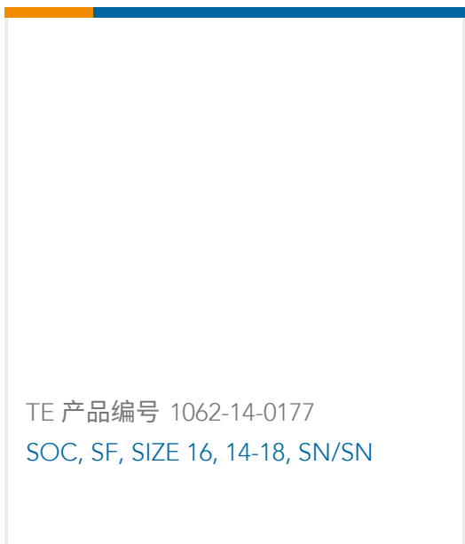
TE 产品编号 1062-14-0177 SOC, SF, SIZE 16, 14-18, SN/SN