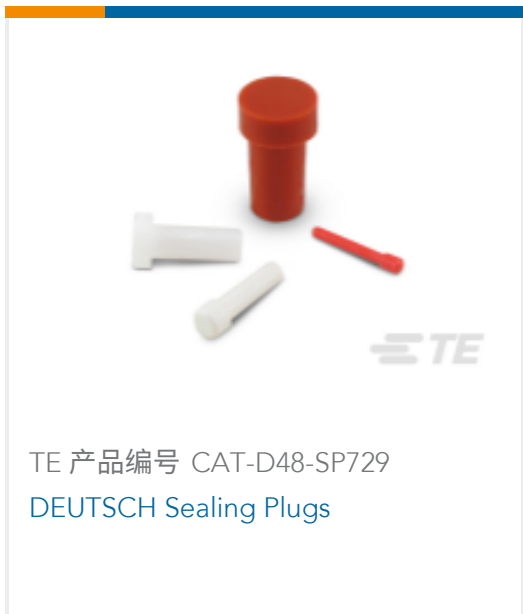
TE 产品编号 CAT-D48-SP729 DEUTSCH Sealing Plugs