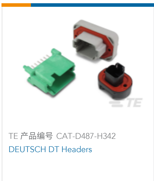
TE 产品编号 CAT-D487-H342 DEUTSCH DT Headers