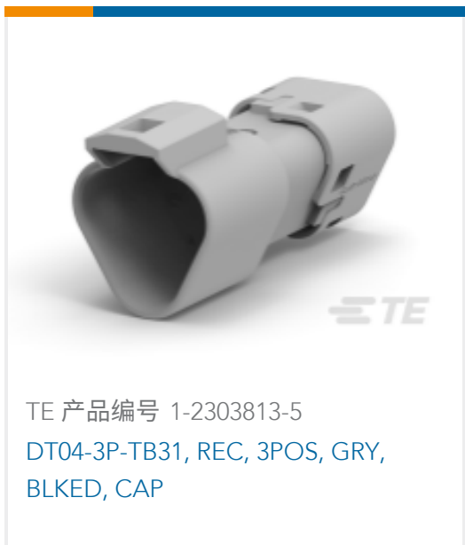
TE 产品编号 1-2303813-5 DT04-3P-TB31, REC, 3POS, GRY, BLKED, CAP