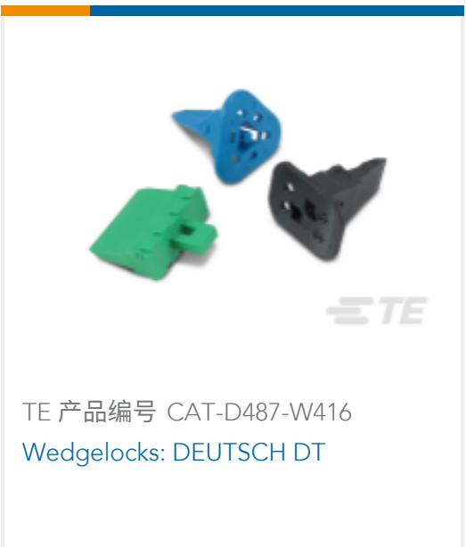
TE 产品编号 CAT-D487-W416 Wedgelocks: DEUTSCH DT