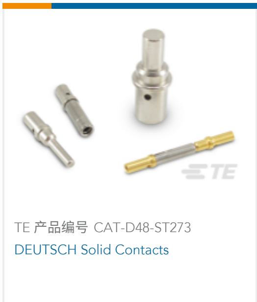
TE 产品编号 CAT-D48-ST273 DEUTSCH Solid Contacts