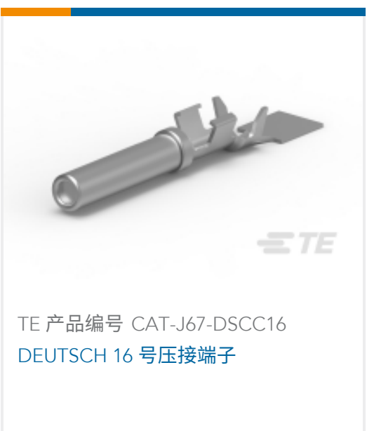
TE 产品编号 CAT-J67-DSCC16 DEUTSCH 16 号压接端子