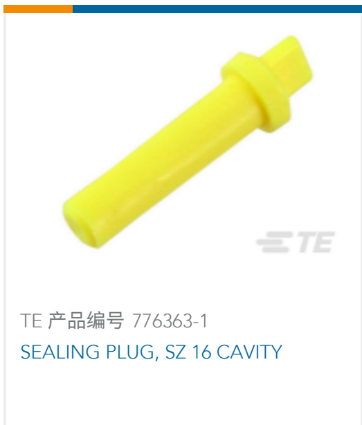
TE 产品编号 776363-1 SEALING PLUG, SZ 16 CAVITY