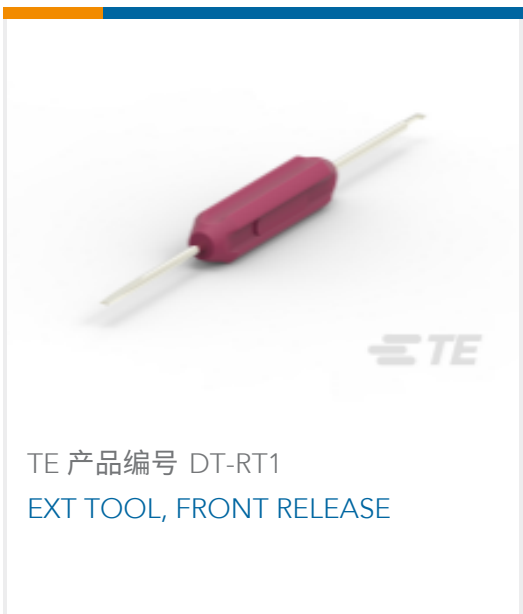
TE 产品编号 DT-RT1 EXT TOOL, FRONT RELEASE