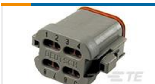
TE 产品编号DT06-08SA-CE01 PLG, 8P, GRY, E, CAP, A