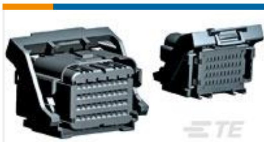
TE 产品编号1438618-1 40 WAY ARM PLUG, KEY H NSB