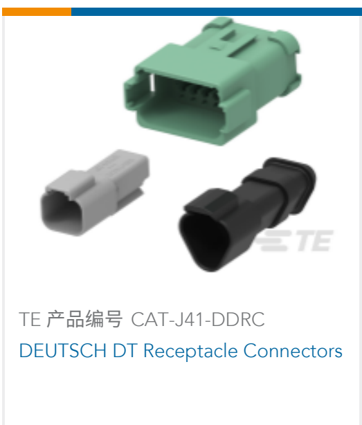
TE 产品编号 CAT-J41-DDRC DEUTSCH DT Receptacle Connectors