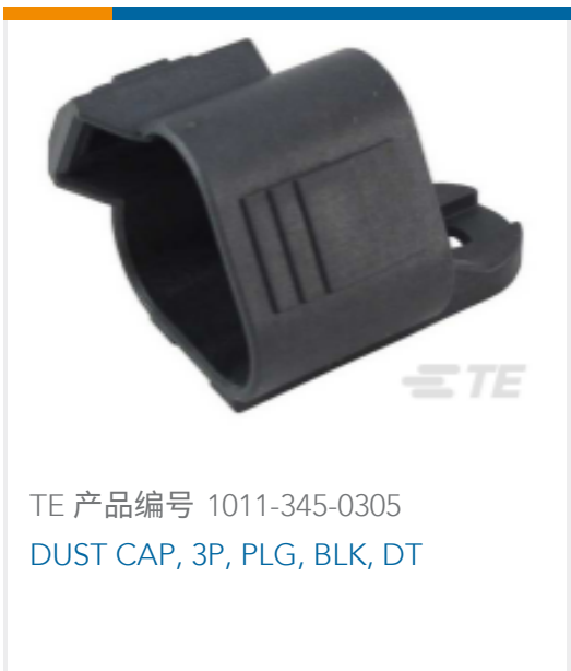
TE 产品编号 1011-345-0305 DUST CAP, 3P, PLG, BLK, DT