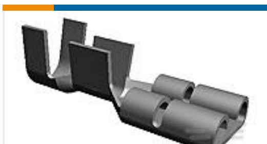
TE 产品编号444334-2 250 FASTON REC 22-18 AWG TPBR