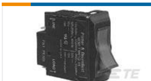
TE 产品编号1393248-7 W33-S1N1Q-15=W33