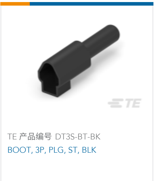
TE 产品编号 DT3S-BT-BK BOOT, 3P, PLG, ST, BLK