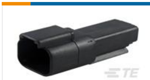
TE 产品编号DT04-2P-E004 REC, 2P, BLK, N