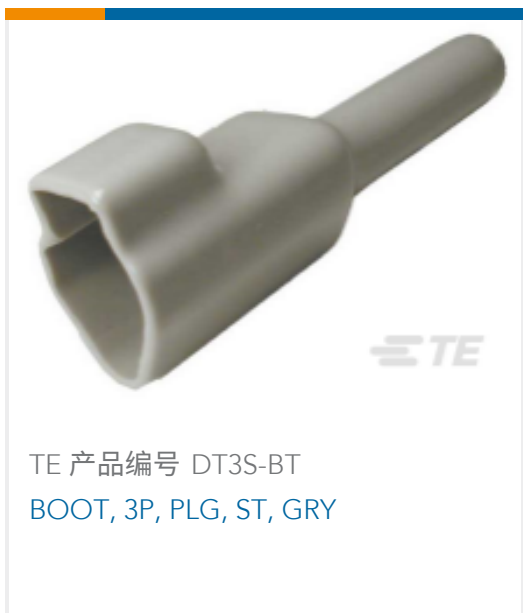
TE 产品编号 DT3S-BT BOOT, 3P, PLG, ST, GRY