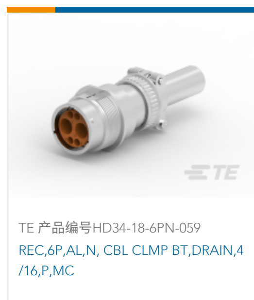
TE 产品编号HD34-18-6PN-059 REC,6P,AL,N, CBL CLMP BT,DRAIN,4 /16,P,MC