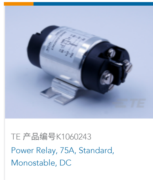
TE 产品编号K1060243 Power Relay, 75A, Standard, Monostable, DC