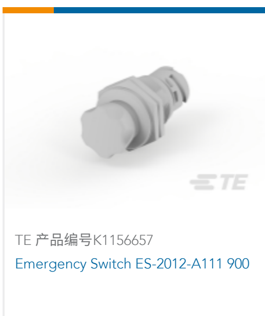
TE 产品编号K1156657 Emergency Switch ES-2012-A111 900