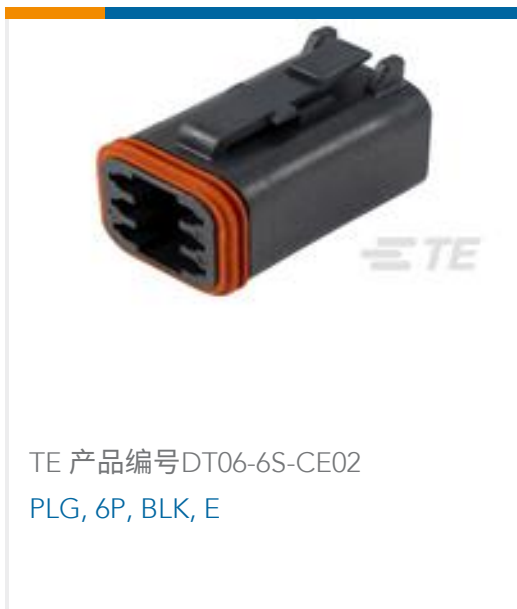
TE 产品编号DT06-6S-CE02 PLG, 6P, BLK, E