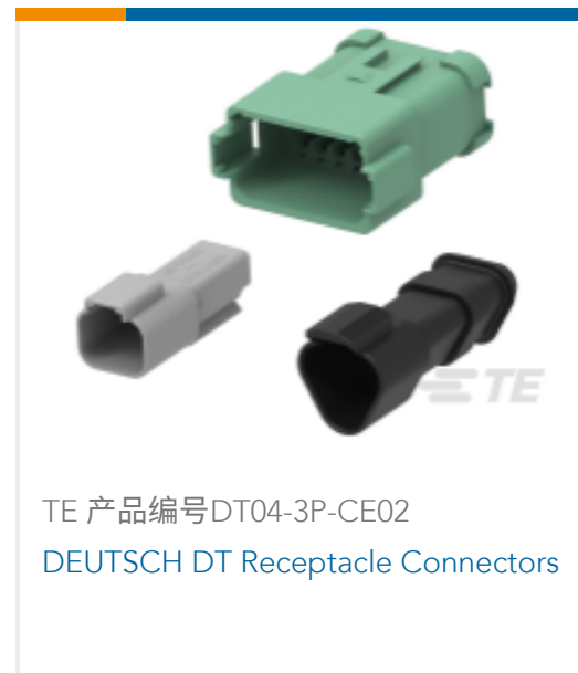
TE 产品编号DT04-3P-CE02 DEUTSCH DT Receptacle Connectors