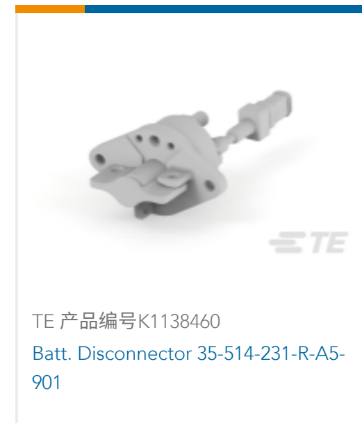
TE 产品编号K1138460 Batt. Disconnect 35-514-231-R-A5- 901