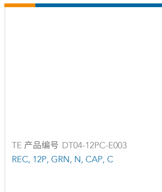
TE 产品编号 DT04-12PC-E003 REC, 12P, GRN, N, CAP, C