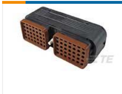
TE 产品编号DRC16-70SB-P013 PLG, 70P, BLK, N, SEAL BOND, B