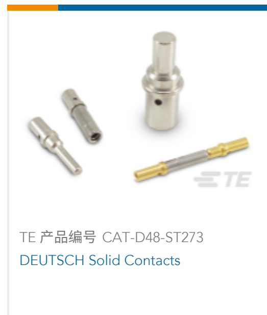
TE 产品编号 CAT-D48-ST273 DEUTSCH Solid Contacts