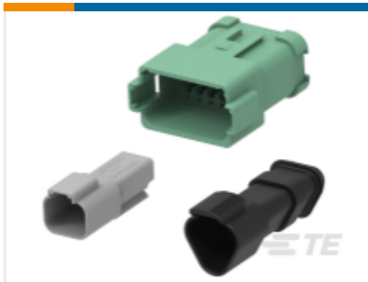
TE 产品编号DT04-12PA-BE02 DEUTSCH DT Receptacle Connectors