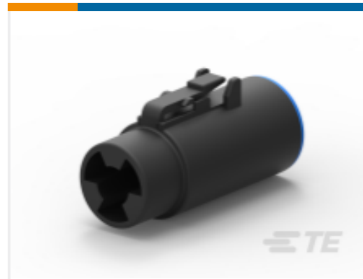
TE 产品编号DTCE06-1-4S-E003 DTCE PLUG ASM