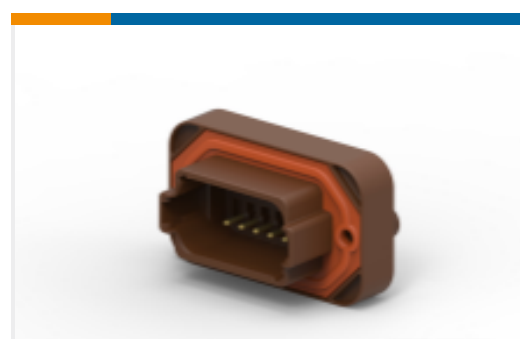
TE 产品编号DT15-12PD HDR, 12P, BRN, ST, NI/CU, D