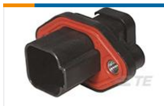
TE 产品编号DT04-6P-CL09 REC, 6P, BLK, E, CAP, FLANGE