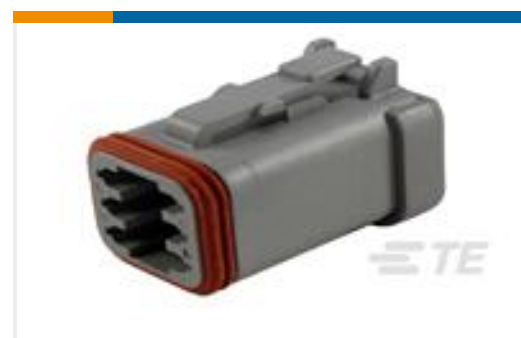
TE 产品编号DT06-6S-E003 PLG, 6P, GRY, N, CAP