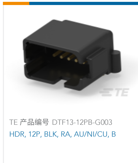
TE 产品编号 DTF13-12PB-G003 HDR, 12P, BLK, RA, AU/NI/CU, B