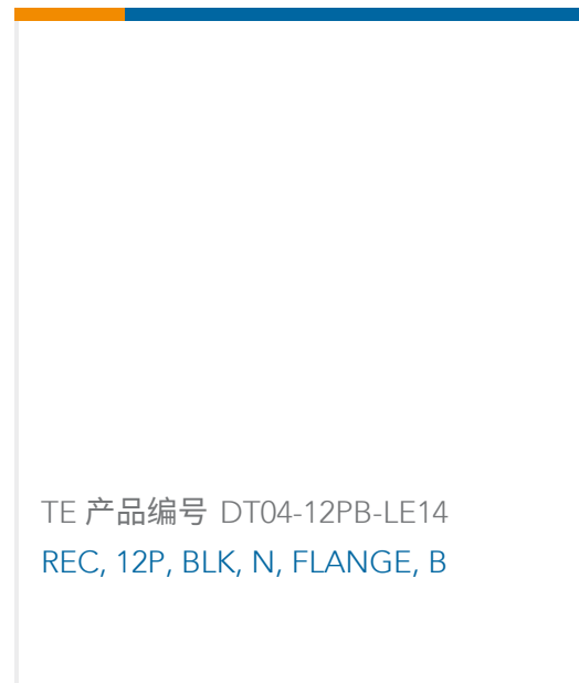
TE 产品编号 DT04-12PB-LE14 REC, 12P, BLK, N, FLANGE, B