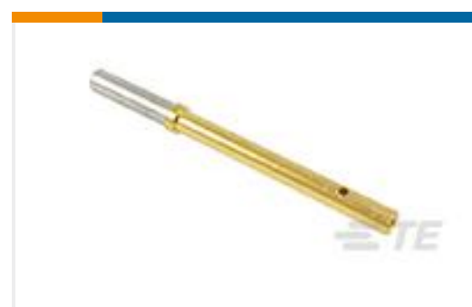
TE 产品编号0462-221-1631 SOC, SOLID, SIZE 16, 16-20AWG, EXT, AU