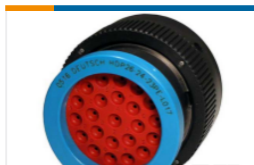
TE 产品编号HDP26-24-23PE-L017 PLG, 23P, BLK, E, RNG, 16, P