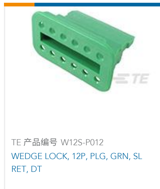
TE 产品编号 W12S-P012 WEDGE LOCK, 12P, PLG, GRN, SL RET, DT