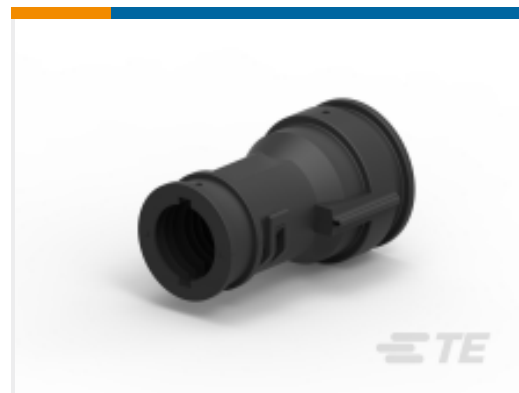
TE 产品编号2428-016-1805 BKSHL, 18SZ, BLK, ST,NW13/17/19, L017,HDP