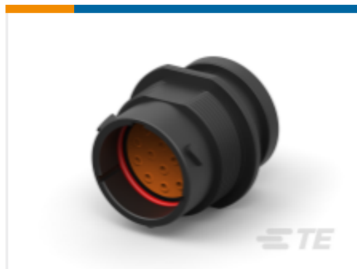
TE 产品编号HDP24-18-14PN-L017 REC, 14P, BLK, N, RNG, 16, P