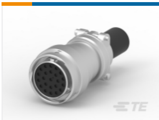
TE 产品编号HD36-24-23SN-059 PLG,23P,AL,N, CBL CLMP BT, DRAIN, 16,S,MC