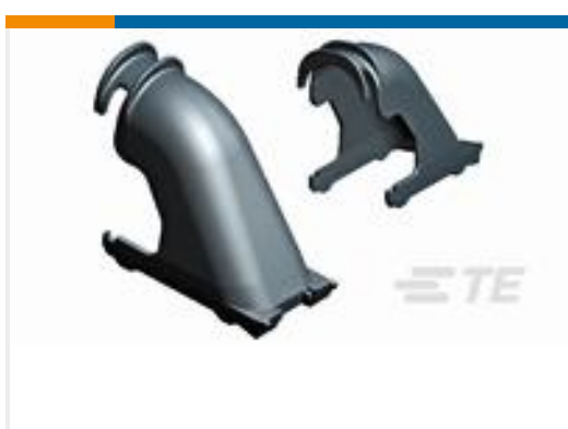
TE 产品编号1746817-1 SEALED EFI ECU 60P PLUG WIRE COVER