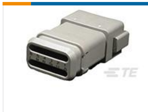
TE 产品编号DT04-12PA-E008 REC, 12P, GRY, N, XCAP, A