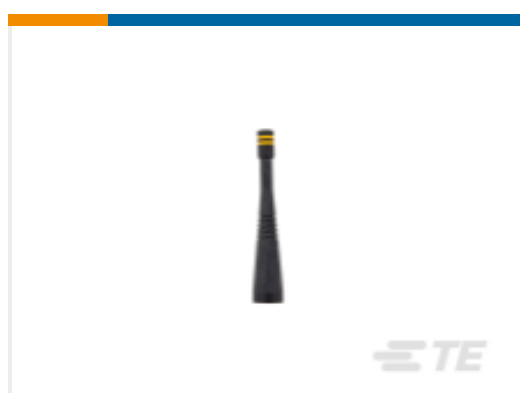
TE 产品编号ANT-916-CW-QW Antenna 1/4 Wave Whip 916MHz