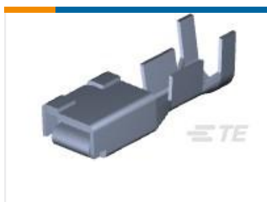
TE 产品编号179956-6 DYNAMIC D-5 REC M AG FORM