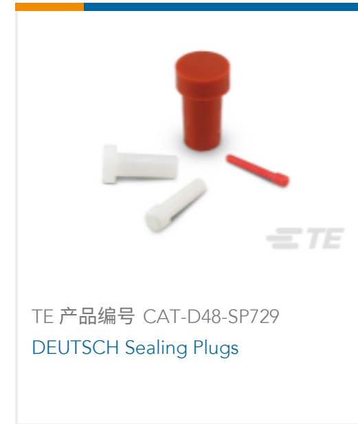
TE 产品编号 CAT-D48-SP729 DEUTSCH Sealing Plugs