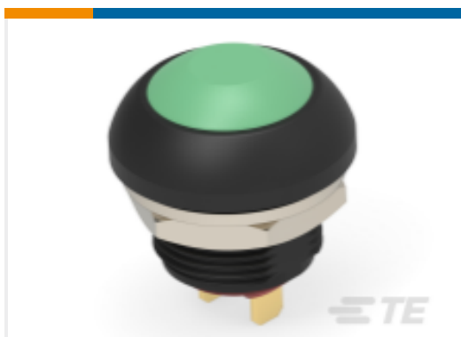
TE 产品编号2329383-4 PB OFF/ON FC GRE M1 TERM. IP68