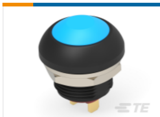
TE 产品编号2329383-5 PB OFF/ON FC BLU M1 TERM. IP68