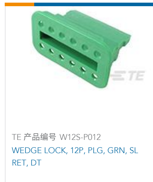
TE 产品编号 W12S-P012 WEDGE LOCK, 12P, PLG, GRN, SL RET, DT