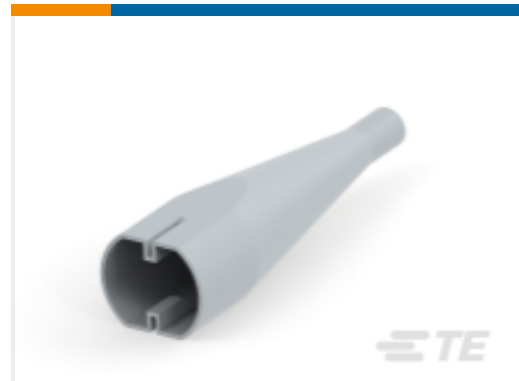
TE 产品编号DT48S-BT BOOT, 48P, PLG, ST, GRY