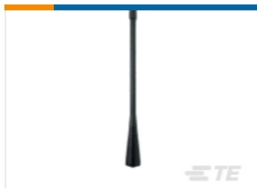
TE 产品编号EXC902TN DUCK,EXC,902-960MHz,1/4W TNCM, 4 INCH