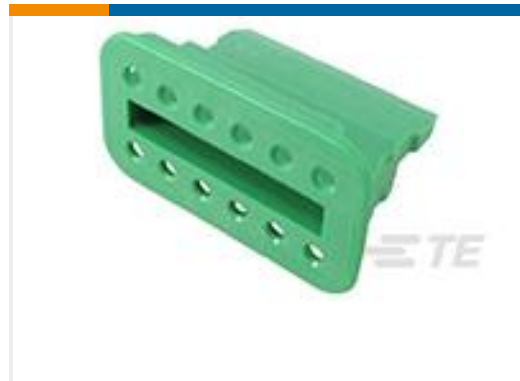
TE 产品编号W12S-P012 WEDGE LOCK, 12P, PLG, GRN, SL RET, DT