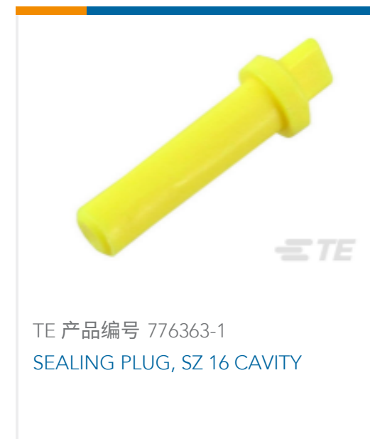
TE 产品编号 776363-1 SEALING PLUG, SZ 16 CAVITY