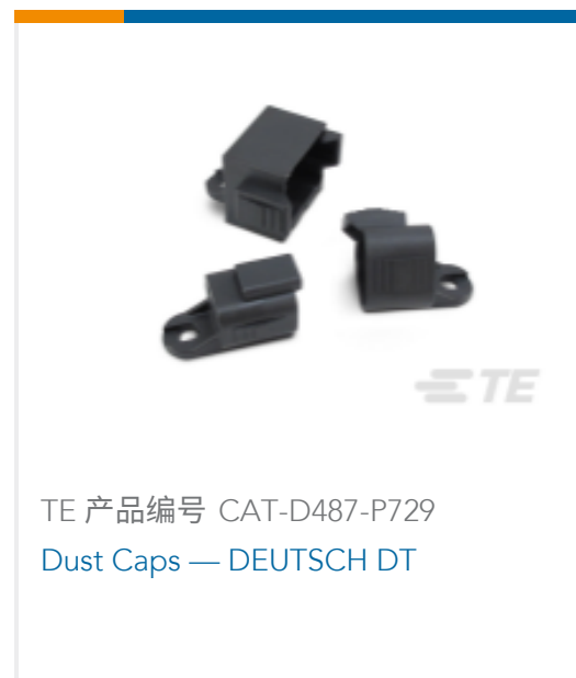
TE 产品编号 CAT-D487-P729 Dust Caps — DEUTSCH DT