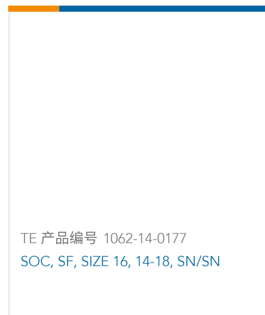
TE 产品编号 1062-14-0177 SOC, SF, SIZE 16, 14-18, SN/SN