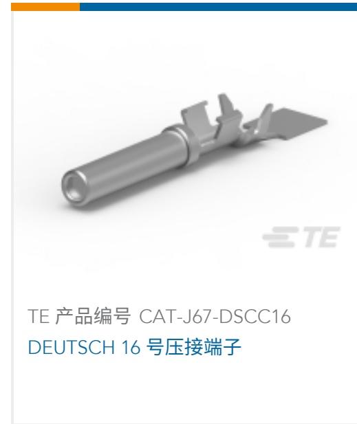
TE 产品编号 CAT-J67-DSCC16 DEUTSCH 16号压接端子