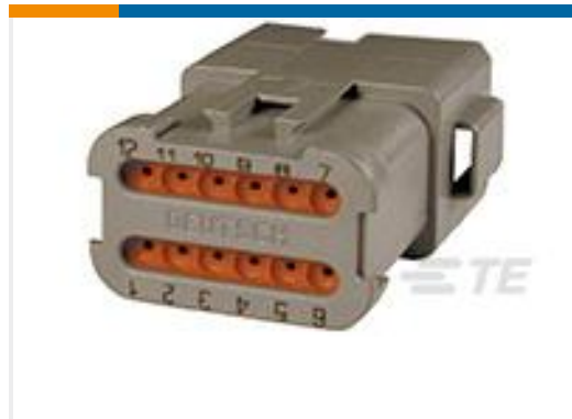
TE 产品编号DT04-12PA-BE02 REC, 12P, GRY, N, ENH KEY, CAP, A