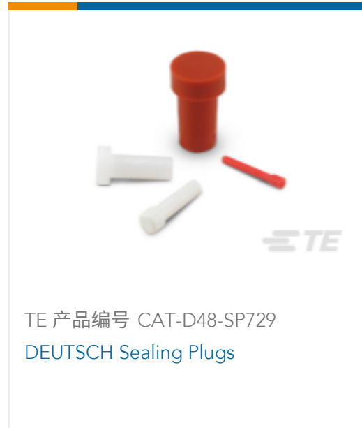
TE 产品编号 CAT-D48-SP729 DEUTSCH Sealing Plugs