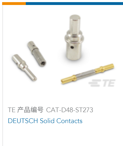
TE 产品编号 CAT-D48-ST273 DEUTSCH Solid Contacts