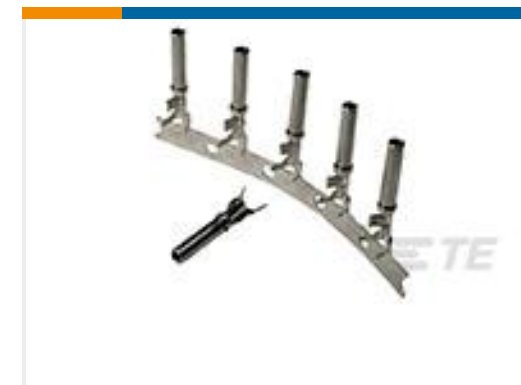
TE 产品编号1062-14-0122 SOC, SF, SIZE 16, 14-18, NI/SN