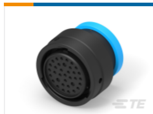
TE 产品编号2289831-1 HDP26-24-35SE-L017, PLG, 35P, E, THD, S