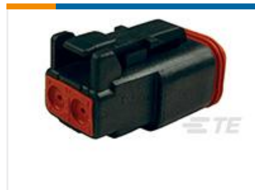
TE 产品编号DT06-2S-CE06 PLG, 2P, BLK, E, SEAL RET