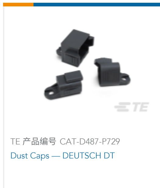
TE 产品编号 CAT-D487-P729 Dust Caps — DEUTSCH DT