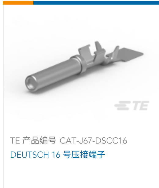
TE 产品编号 CAT-J67-DSCC16 DEUTSCH 16号压接端子