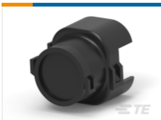
TE 产品编号180-DTP04 BKSHL, 4P, BLK, PLG, ST, SIDE AB, NW 16