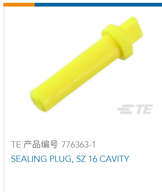
TE 产品编号 776363-1 SEALING PLUG, SZ 16 CAVITY