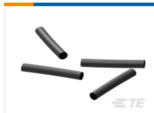
TE 产品编号EK5194-000 ES2000-NO.6-H2-0-39MM