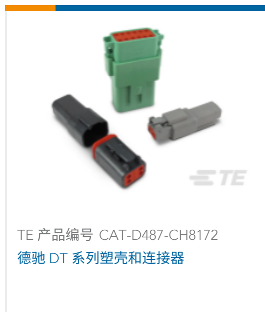
TE 产品编号 CAT-D487-CH8172 德驰 DT 系列塑壳和连接器