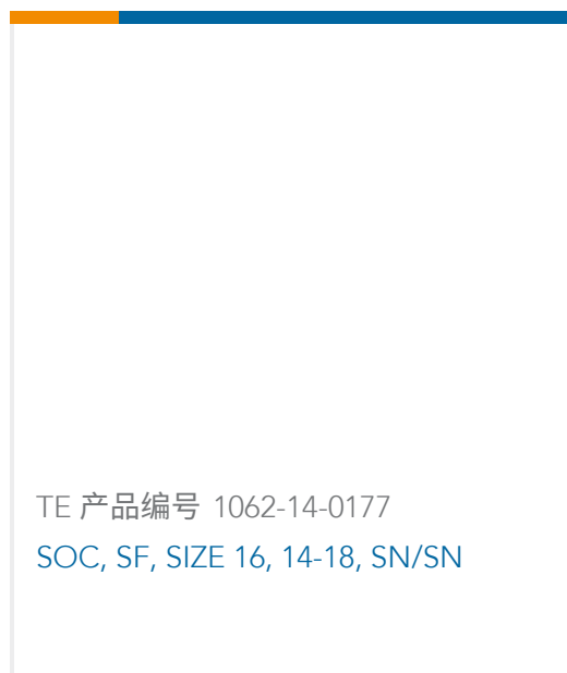
TE 产品编号 1062-14-0177 SOC, SF, SIZE 16, 14-18, SN/SN