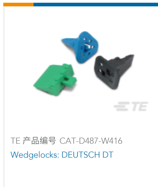
TE 产品编号 CAT-D487-W416 Wedgelocks: DEUTSCH DT