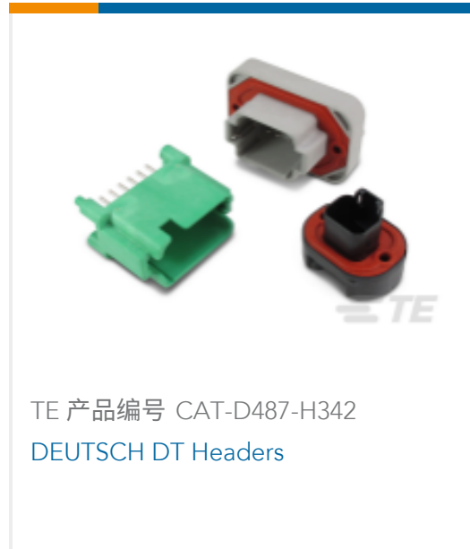
TE 产品编号 CAT-D487-H342 DEUTSCH DT Headers