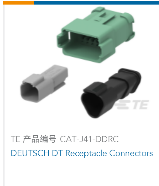
TE 产品编号 CAT-J41-DDRC DEUTSCH DT Receptacle Connectors