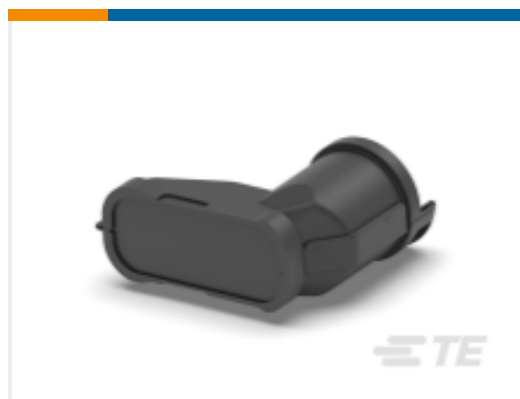
TE 产品编号SRK-BS-MD-ST-002 BKSHL, MED, BLK, ST, NW 22