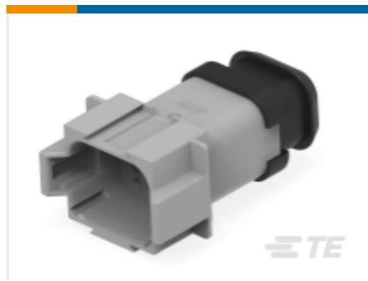
TE 产品编号DT04-08PA-CE04 REC, 8P, GRY, E, XCAP, A