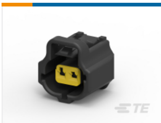
TE 产品编号2822365-1 EJ-2 DBL LOCK PLUG ASSY 2P (D) BLACK