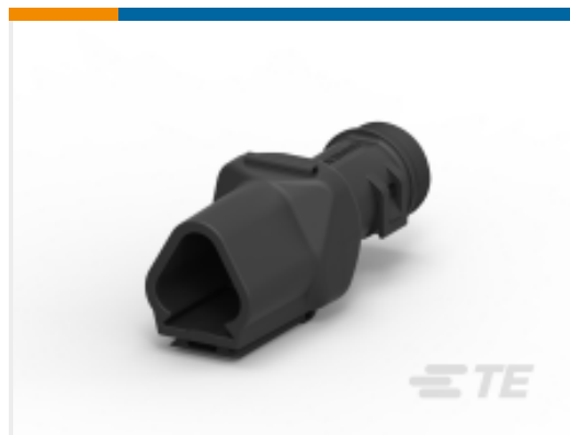
TE 产品编号1011-261-0305 BKSHL, 3P, BLK, REC,ST,SR,NW6/7.5/8.5/10