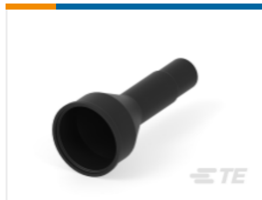
TE 产品编号HD10-9BT-BK BOOT, 9P, PLG/REC, ST, BLK