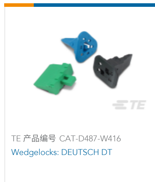
TE 产品编号 CAT-D487-W416 Wedglocks: DEUTSCH DT