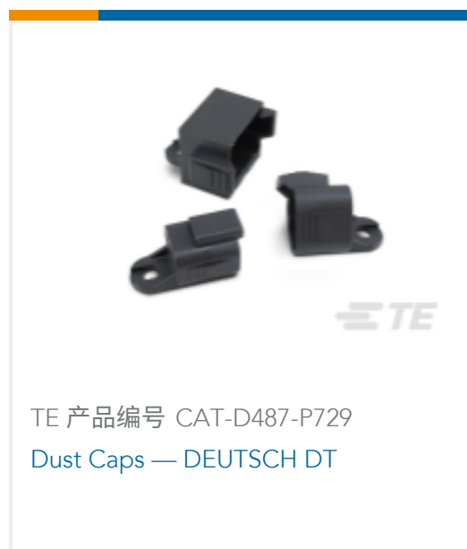
TE 产品编号 CAT-D487-P729 Dust Caps — DEUTSCH DT