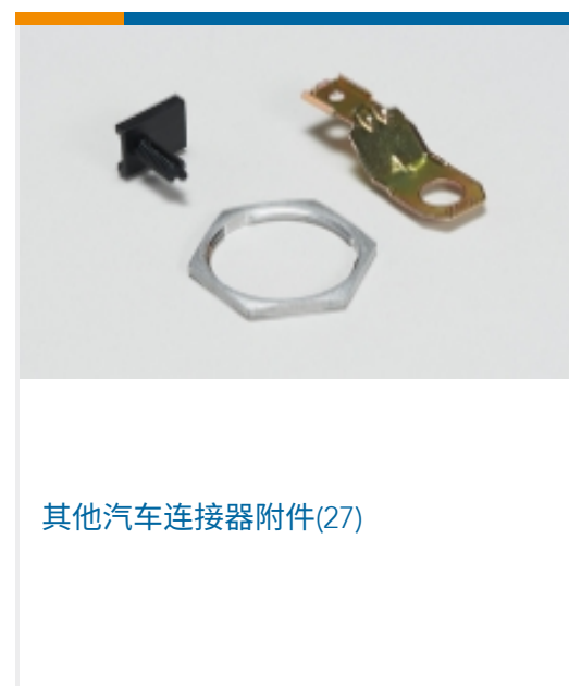
其他汽车连接器附件(27)