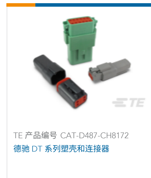
TE 产品编号 CAT-D487-CH8172 德驰 DT 系列塑壳和连接器