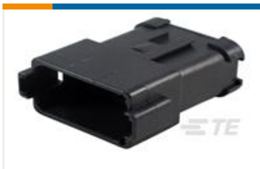
TE 产品编号DT04-12PB-CE01 REC, 12P, BLK, E, CAP, B