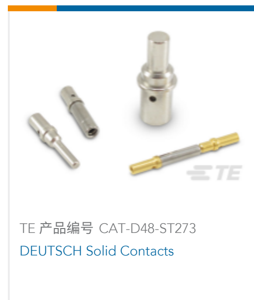
TE 产品编号 CAT-D48-ST273 DEUTSCH Solid Contacts