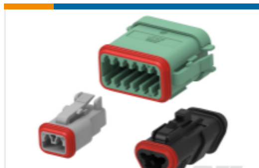
TE 产品编号DT06-6S-CE01 DEUTSCH DT Plug Connectors