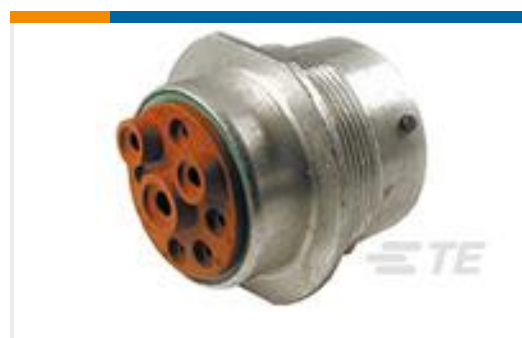
TE 产品编号HD34-24-9SN REC, 9P, AL, N, 4/8/12, S