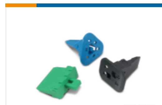
TE 产品编号W8S Wedgelocks: DEUTSCH DT