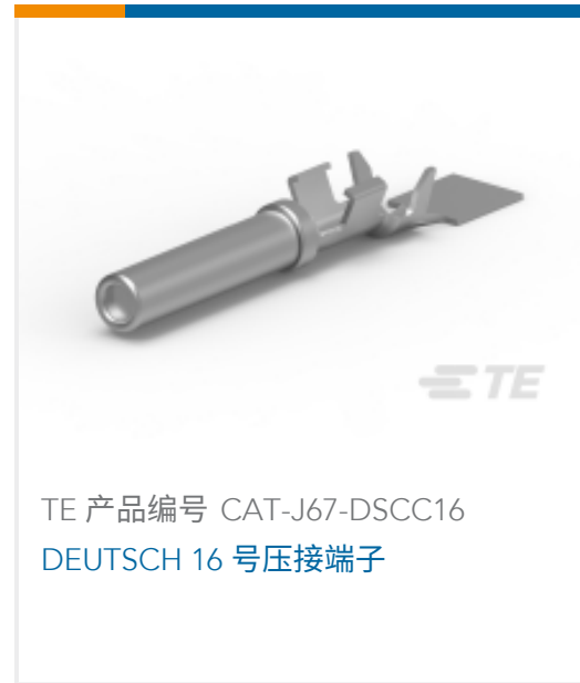
TE 产品编号 CAT-J67-DSCC16 DEUTSCH 16号压接端子