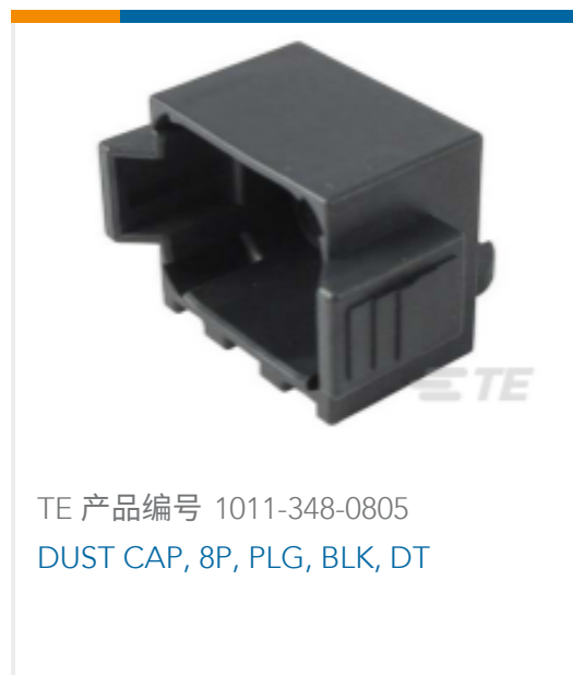
TE 产品编号 1011-348-0805 DUST CAP, 8P, PLG, BLK, DT