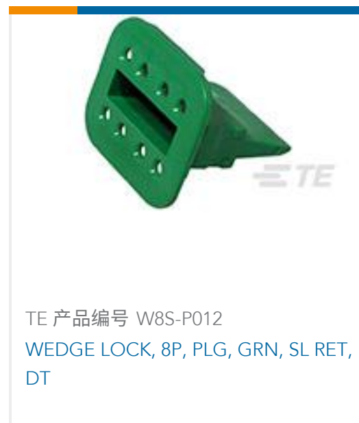
TE 产品编号 W8S-P012 WEDGE LOCK, 8P, PLG, GRN, SL RET, DT