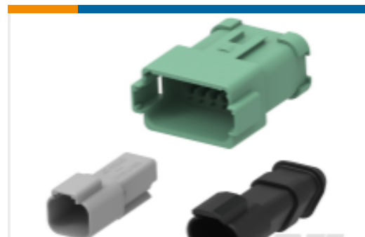
TE 产品编号DT04-12PA-BE02 DEUTSCH DT Receptacle Connectors