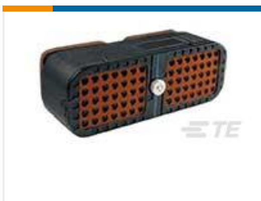
TE 产品编号DRC16-70SAE-P013 PLG, 70P, BLK, E, SEAL BOND, A