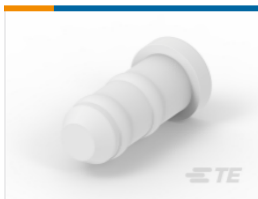
TE 产品编号172189-1 ECONOSEAL-J FILTER CHIP