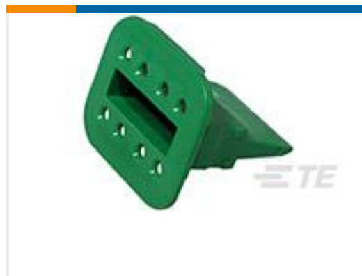
TE 产品编号W8S-P012 WEDGE LOCK, 8P, PLG, GRN, SL RET, DT