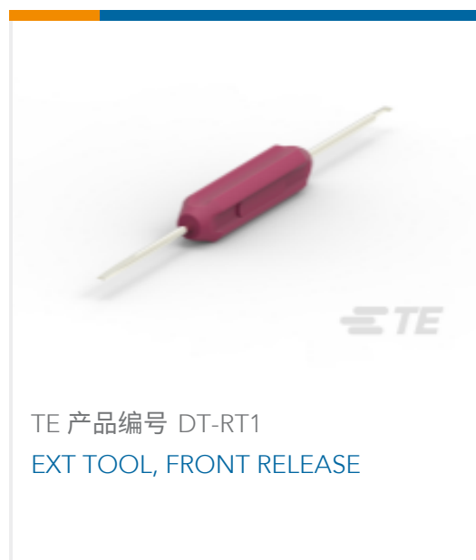
TE 产品编号 DT-RT1 EXT TOOL, FRONT RELEASE