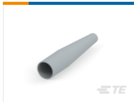
TE 产品编号DTP4S-BT-EN BOOT, 4P, PLG, ST, LONG, GRY DT