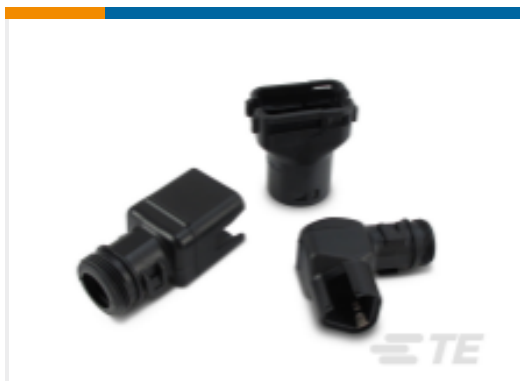
TE 产品编号1011-258-0205 DEUTSCH DT Backshells