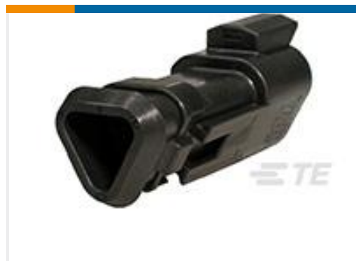
TE 产品编号DT04-3P-CE09 REC, 3P, BLK, E, XCAP