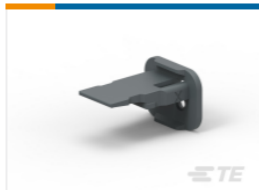
TE 产品编号W2SA-P012 WEDGE LOCK, 2P, PLG, GRY, SL RET, DT, A