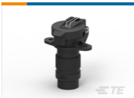
TE 产品编号CAR2SC68 CAR RECPT DIN9680 2way, IP68