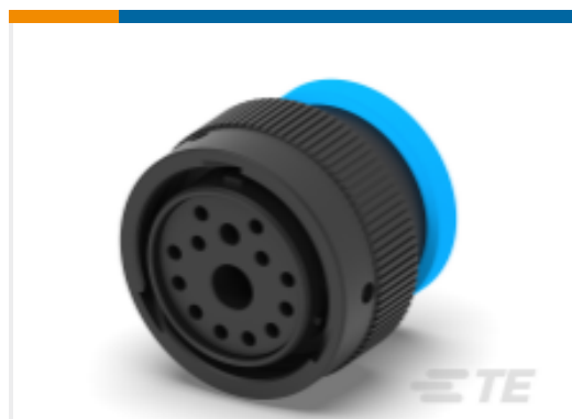
TE 产品编号HDP26-24-14SE-L017 PLG, 14P, BLK, E, RNG, 4/12/16, S