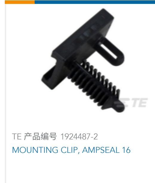
TE 产品编号 1924487-2 MOUNTING CLIP, AMPSEAL 16