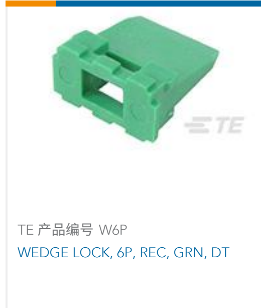
TE 产品编号 W6P WEDGE LOCK, 6P, REC, GRN, DT