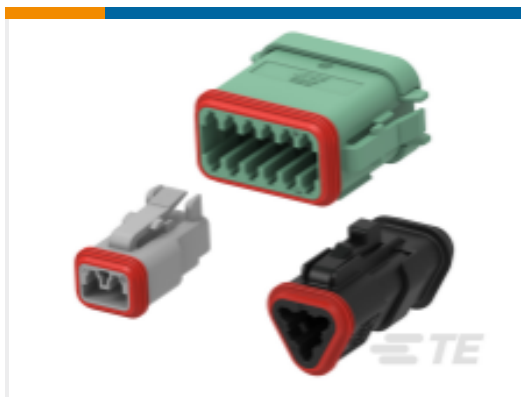
TE 产品编号DT06-6S-E008 DEUTSCH DT Plug Connectors