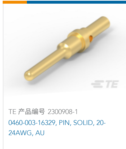
TE 产品编号 2300908-1 0460-003-16329, PIN, SOLID, 20-24AWG, AU