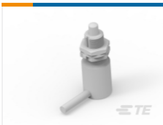
TE 产品编号K1145366 Limit switch G12-221-S-015