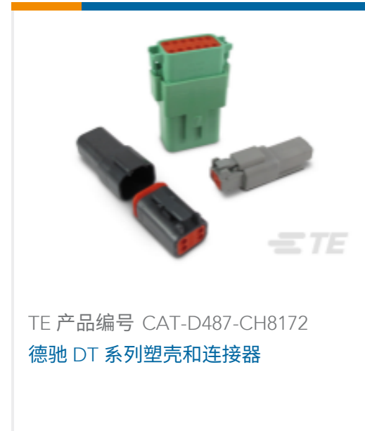
TE 产品编号 CAT-D487-CH8172 德驰 DT 系列塑壳和连接器