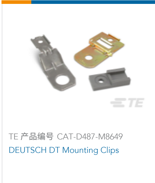
TE 产品编号 CAT-D487-M8649 DEUTSCH DT Mounting Clips