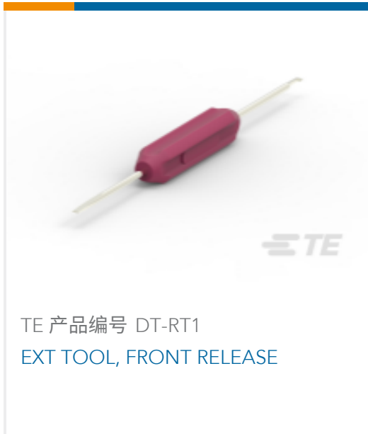
TE 产品编号 DT-RT1 EXT TOOL, FRONT RELEASE