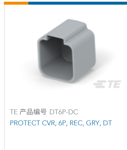
TE 产品编号 DT6P-DC PROTECT CVR, 6P, REC, GRY, DT