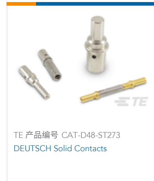
TE 产品编号 CAT-D48-ST273 DEUTSCH Solid Contacts