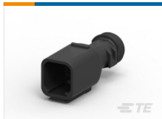
TE 产品编号1011-269-0605 BKSHL, 6P, BLK, REC, ST, SR, NW8.5 /10/13