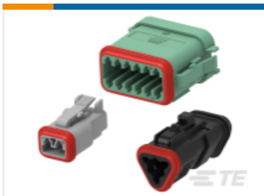
TE 产品编号DT06-6S-CE02 DEUTSCH DT Plug Connectors