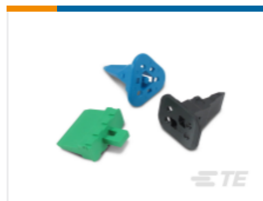
TE 产品编号W6S Wedgelocks: DEUTSCH DT