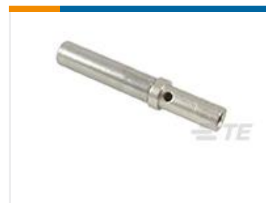
TE 产品编号0462-201-16141 SOC, SOLID, SIZE 16, 16-20AWG, NI