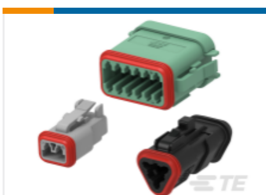
TE 产品编号DT06-3S-P006 DEUTSCH DT Plug Connectors