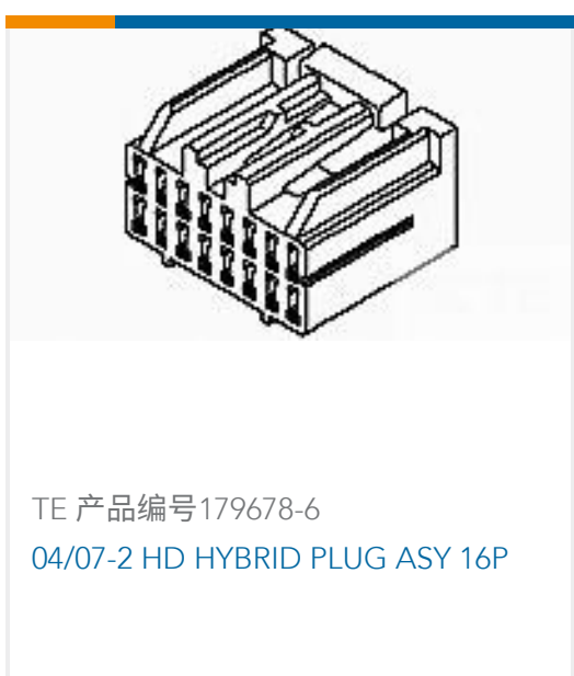
TE 产品编号179678-6 04/07-2 HD HYBRID PLUG ASY 16P