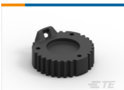
TE 产品编号HDC16-9-E004 DUST CAP ASM