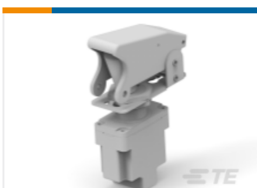
TE 产品编号K1126528 Switch guard 08-0-0-07