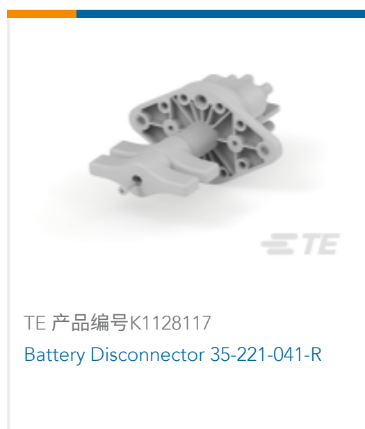
TE 产品编号K1128117 Battery Disconnecter 35-221-041-R