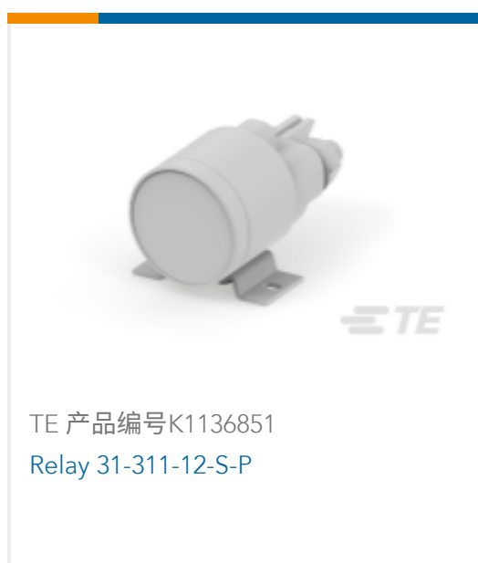
TE 产品编号K1136851 Relay 31-311-12-S-P