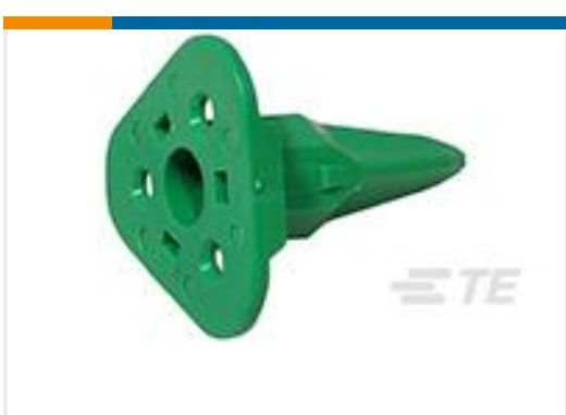
TE 产品编号W3S-P012 WEDGE LOCK, 3P, PLG, GRN, SL RET, DT