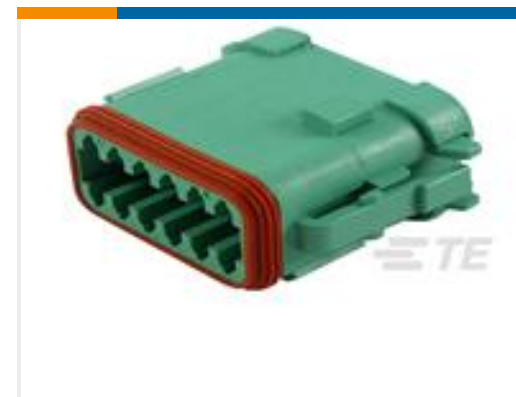
TE 产品编号DT06-12SC-EP06 PLG, 12P, GRN, N, SEAL RET, ENH KEY, CAP, C