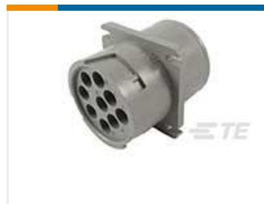
TE 产品编号HD10-9-96PE-B009 SQ FG REC ASM