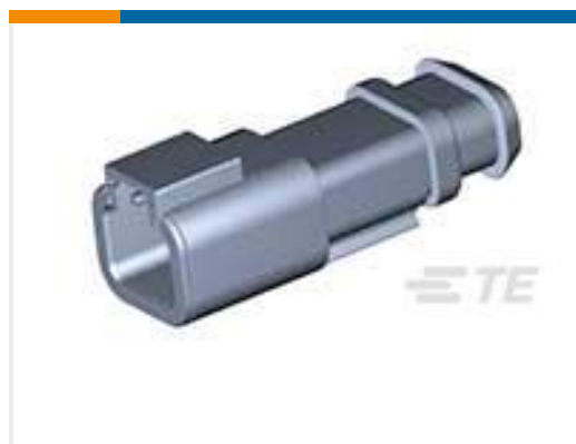
TE 产品编号DTP04-2P-EE01 REC, 2P, BLK, N, XCAP