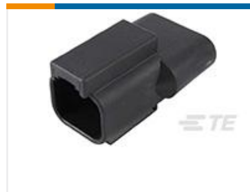
TE 产品编号DT04-2P-RT25 REC, 2P, BLK, 27K OHM RESISTOR, NI