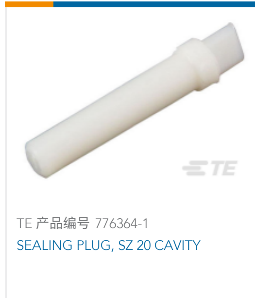
TE 产品编号 776364-1 SEALING PLUG, SZ 20 CAVITY