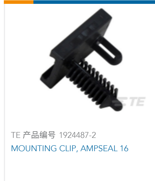
TE 产品编号 1924487-2 MOUNTING CLIP, AMPSEAL 16