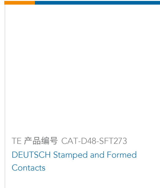
TE 产品编号 CAT-D48-SFT273 DEUTSCH Stamped and Formed Contacts