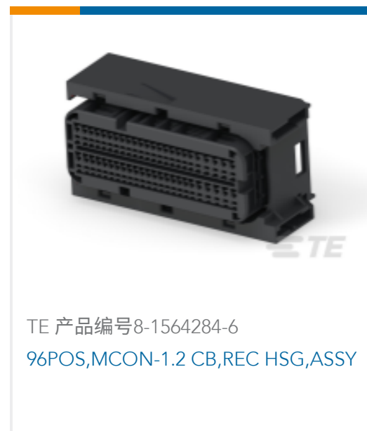
TE 产品编号8-1564284-6 96POS,MCON-1.2 CB,REC HSG,ASSY