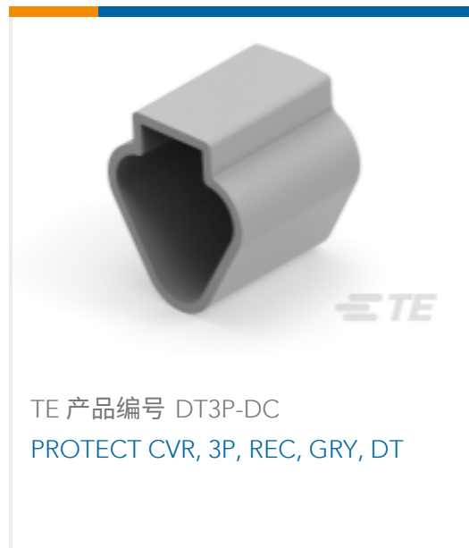
TE 产品编号 DT3P-DC PROTECT CVR, 3P, REC, GRY, DT