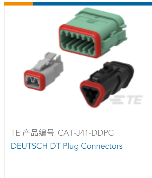
TE 产品编号 CAT-J41-DDPC DEUTSCH DT Plug Connectors