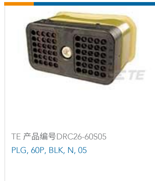
TE 产品编号DRC26-60S05 PLG, 60P, BLK, N, 05