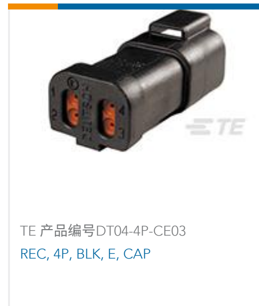
TE 产品编号DT04-4P-CE03 REC, 4P, BLK, E, CAP