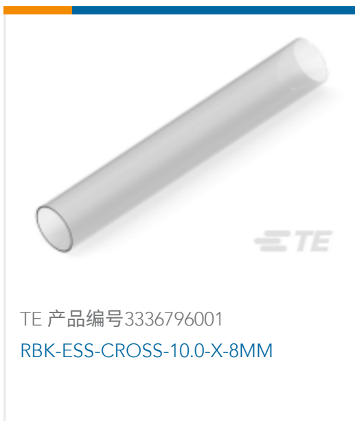
TE 产品编号3336796001 RBK-ESS-CROSS-10.0-X-8MM