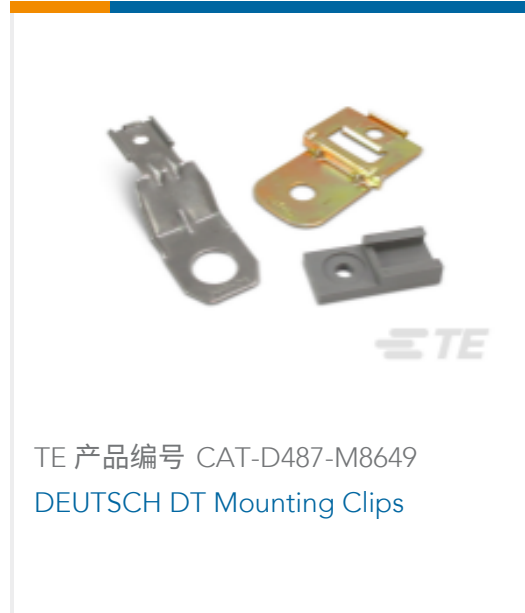
TE 产品编号 CAT-D487-M8649 DEUTSCH DT Mounting Clips