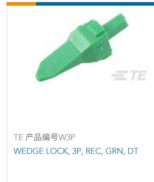
TE 产品编号W3P WEDGE LOCK, 3P, REC, GRN, DT