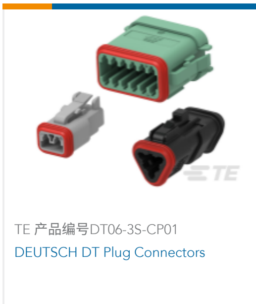
TE 产品编号DT06-3S-CP01 DEUTSCH DT Plug Connectors