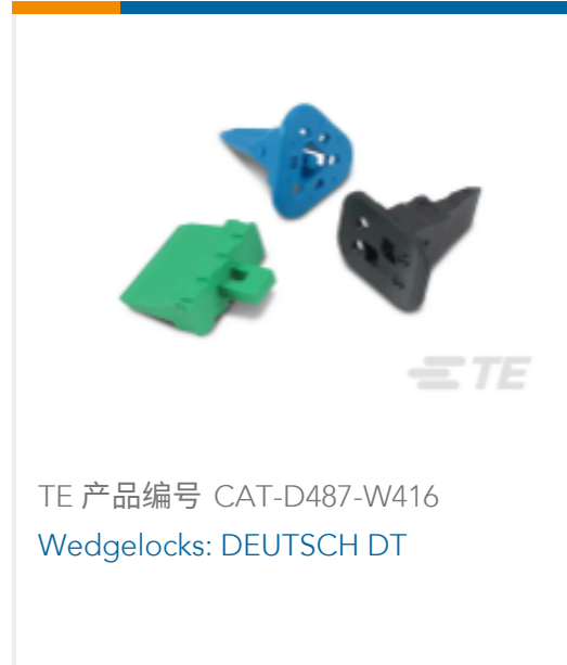
TE 产品编号 CAT-D487-W416 Wedgelocks: DEUTSCH DT