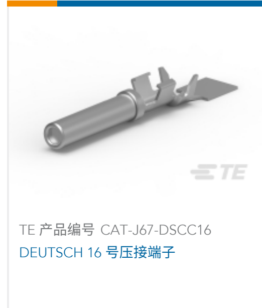
TE 产品编号 CAT-J67-DSCC16 DEUTSCH 16 号压接端子