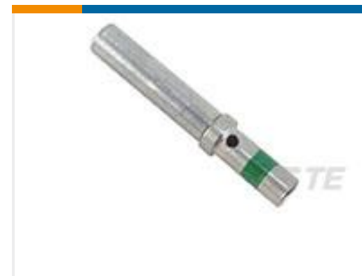
TE 产品编号0462-209-16141 SOC, SOLID, SIZE 16, 14AWG, NI