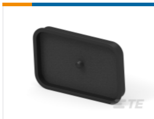
TE 产品编号776305-1 HEADER SEAL CAP ASSY