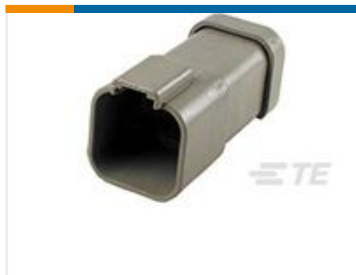
TE 产品编号DT04-6P-CE01 REC, 6P, GRY, E, CAP