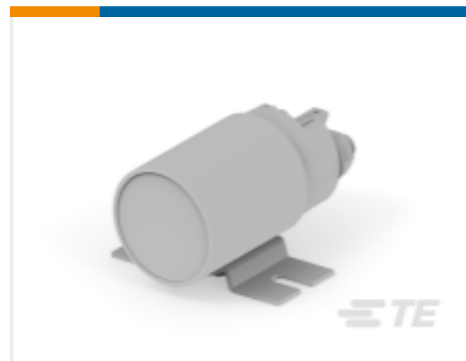
TE 产品编号K1020908 Relay 29-314-11