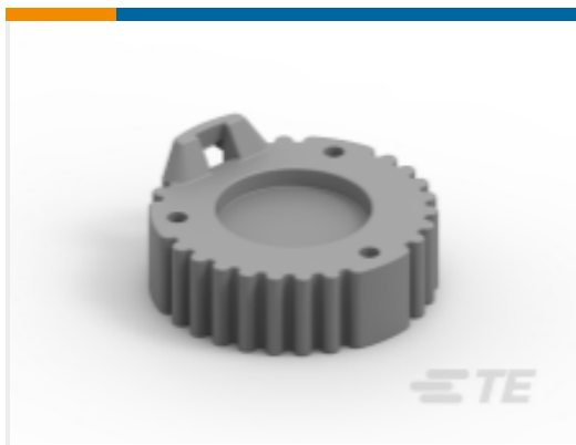
TE 产品编号HDC16-9 DUST CAP ASM