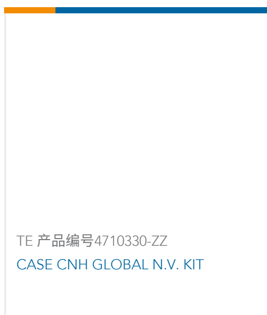
TE 产品编号4710330-ZZ CASE CNH GLOBAL N.V. KIT