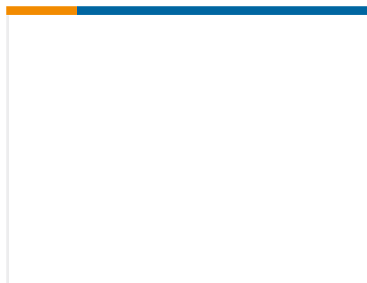
TE 产品编号47410328 CASE CNH GLOBAL N.V. KIT