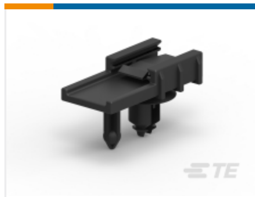
TE 产品编号1011-310-0205 CLIP, PA66, BLK, FIR-TREE, ST