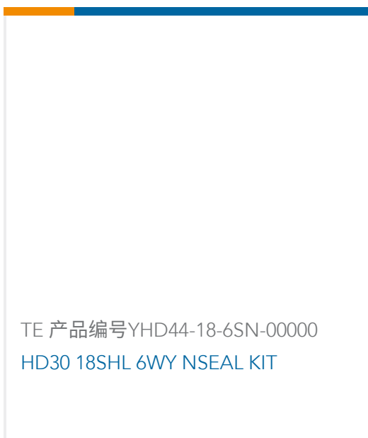
TE 产品编号YHD44-18-6SN-00000 HD30 18SHL 6WY NSEAL KIT