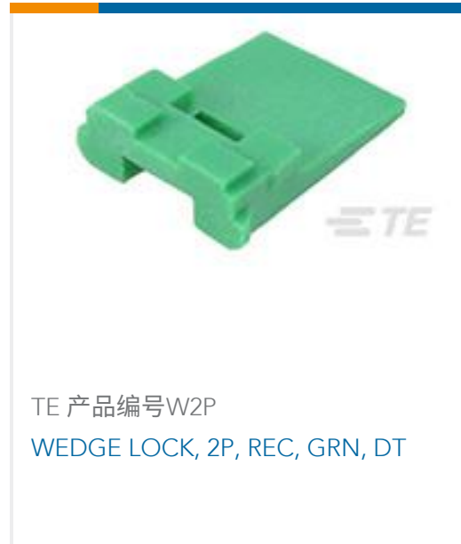
TE 产品编号W2P WEDGE LOCK, 2P, REC, GRN, DT