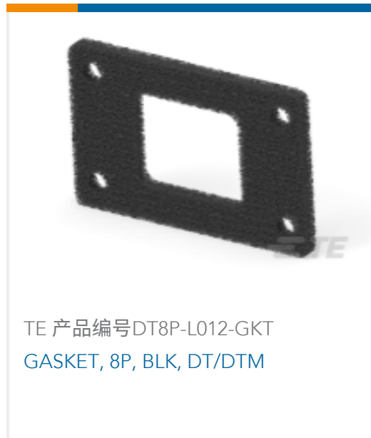
TE 产品编号DT8P-L012-GKT GASKET, 8P, BLK, DT/DTM