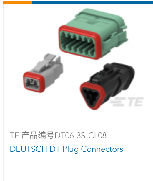
TE 产品编号DT06-3S-CL08 DEUTSCH DT Plug Connectors