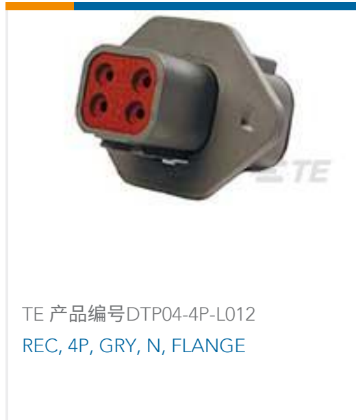
TE 产品编号DTP04-4P-L012 REC, 4P, GRY, N, FLANGE