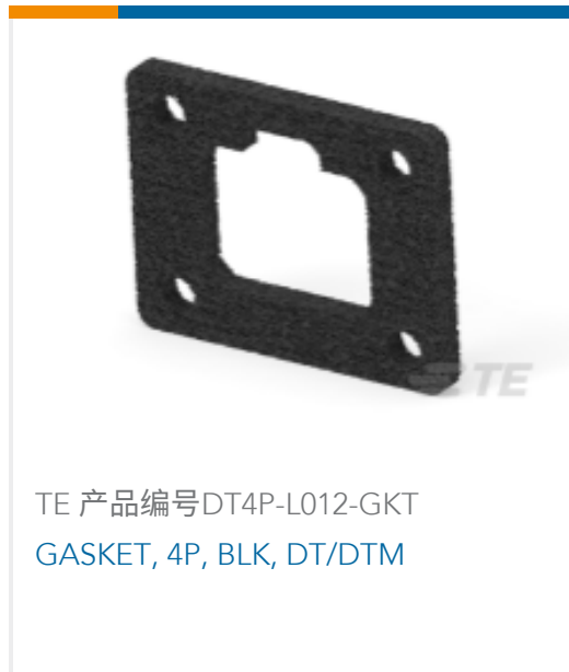
TE 产品编号DT4P-L012-GKT GASKET, 4P, BLK, DT/DTM