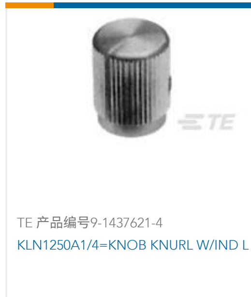
TE 产品编号9-1437621-4 KLN1250A1/4=KNOB KNURL W/IND L