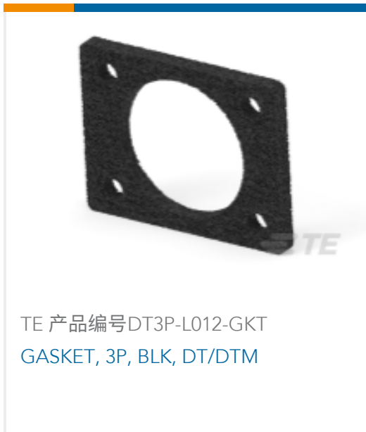
TE 产品编号DT3P-L012-GKT GASKET, 3P, BLK, DT/DTM