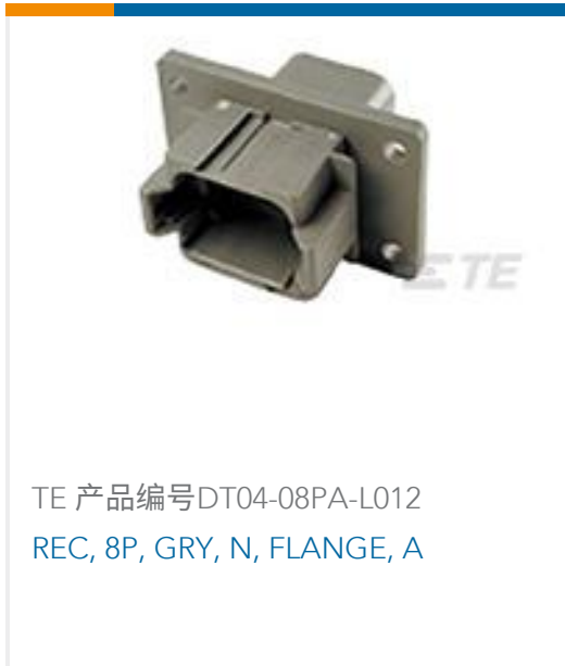
TE 产品编号DT04-08PA-L012 REC, 8P, GRY, N, FLANGE, A