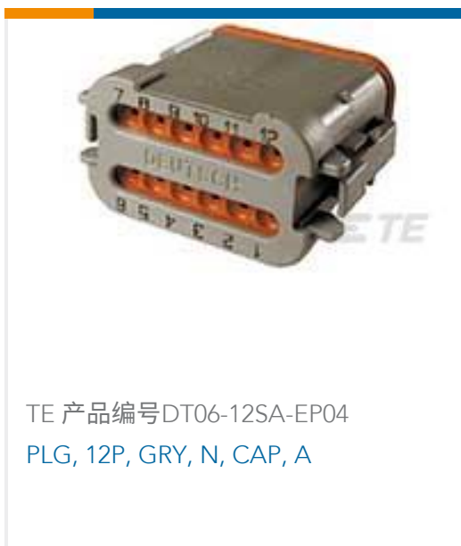
TE 产品编号DT06-12SA-EP04 PLG, 12P, GRY, N, CAP, A