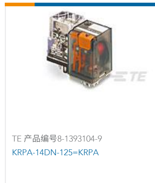
TE 产品编号8-1393104-9 KRPA-14DN-125=KRPA