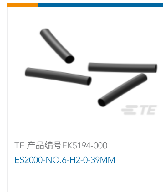
TE 产品编号EK5194-000 ES2000-NO.6-H2-0-39MM