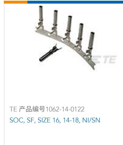
TE 产品编号1062-14-0122 SOC, SF, SIZE 16, 14-18, NI/SN