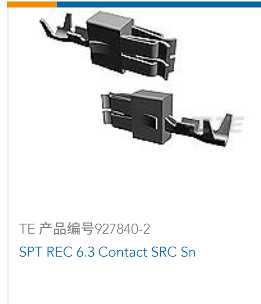
TE 产品编号927840-2 SPT REC 6.3 Contact SRC Sn