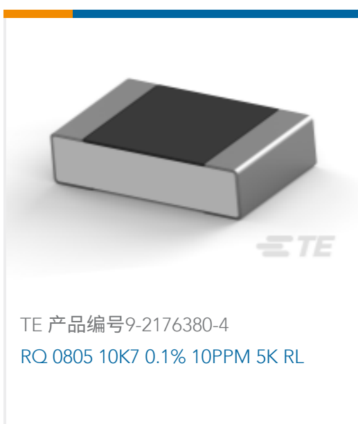
TE 产品编号9-2176380-4 RQ 0805 10K7 0.1% 10PPM 5K RL