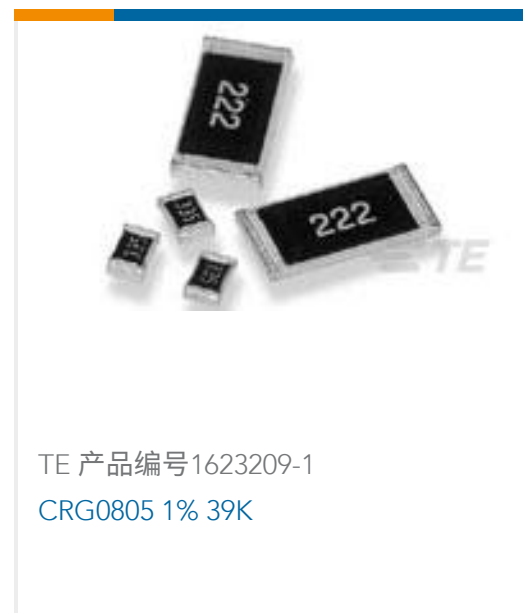
TE 产品编号1623209-1 CRG0805 1% 39K