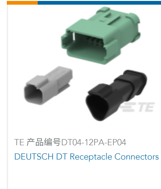
TE 产品编号DT04-12PA-EP04 DEUTSCH DT Receptacle Connectors