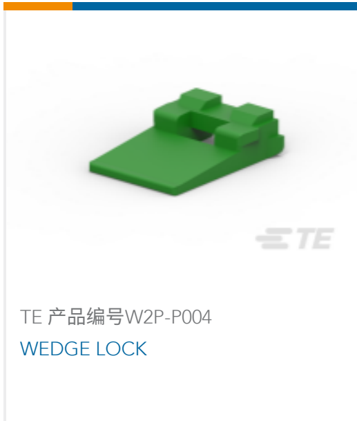
TE 产品编号W2P-P004 WEDGE LOCK