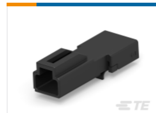
TE 产品编号DTMN04-2P REC, 2P, BLK, N, NON-ENVIR