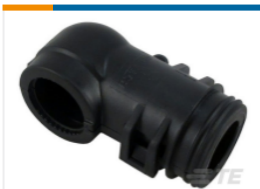
TE 产品编号1011-331-0205 BKSHL, 2P, BLK, PLG, RA, NW 8.5/10