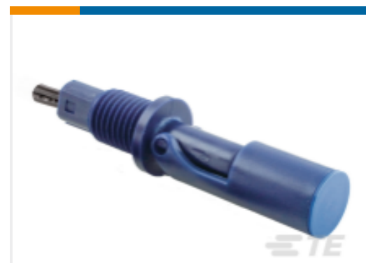
TE 产品编号20017785-00 LS309-52 Liquid Level Sensor