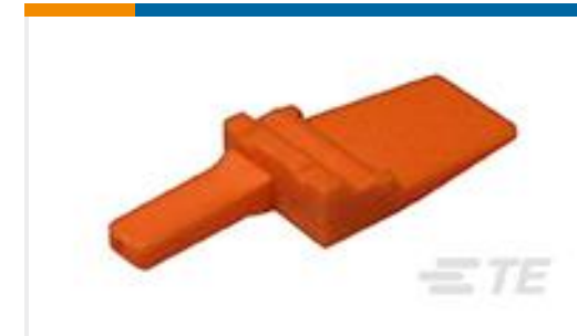
TE 产品编号WM-2P WEDGE LOCK, 2P, REC, ORG, DTM