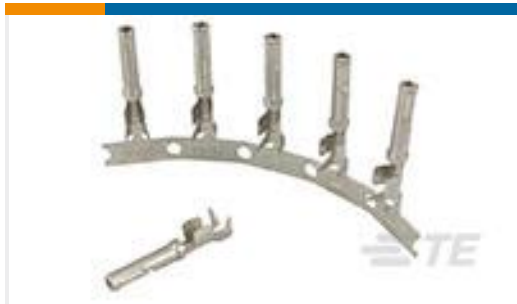
TE 产品编号1062-16-1422 SOC, SF, SIZE 16, 14-18, SLVLES, NI/NI