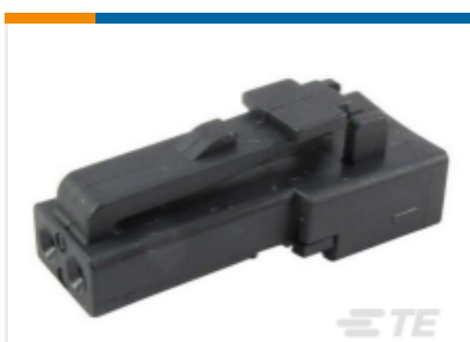
TE 产品编号DTMN06-2S PLG, 2P, BLK, N, NON-ENVIR