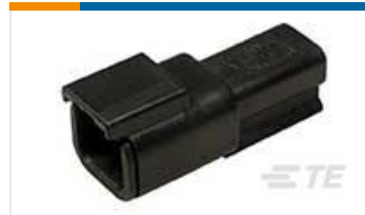
TE 产品编号DTM04-2P-E004 REC, 2P, BLK, N