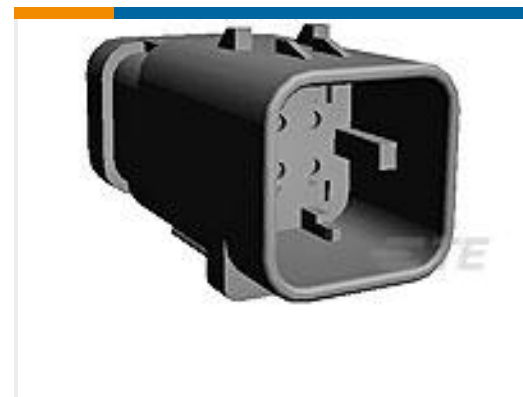
TE 产品编号1717934-2 CAP ASSY,12P,BRACKET REVERSE TYPE,ATAC C