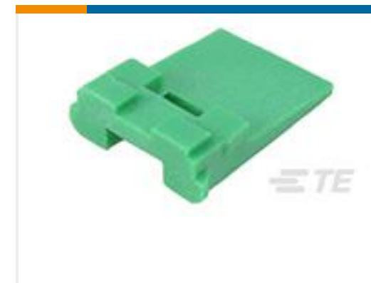
TE 产品编号W2P WEDGE LOCK, 2P, REC, GRN, DT