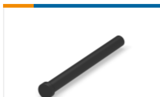
TE 产品编号2236369-1 61103 DVI LOCKING SEALING PLUG #16