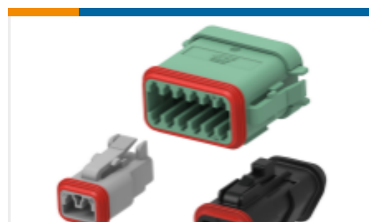
TE 产品编号DT06-12SC-C015 DEUTSCH DT Plug Connectors