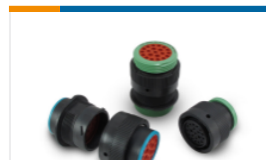
TE 产品编号HDP26-18-20SE-L017 DEUTSCH HDP20 Housings