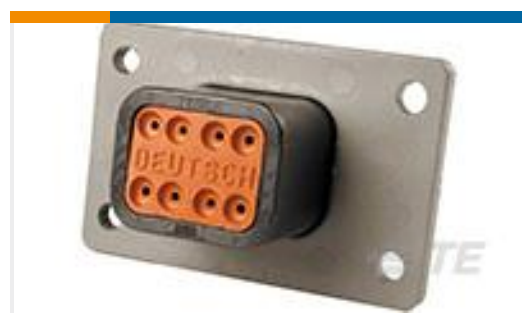
TE 产品编号DT04-08PB-L012 REC, 8P, BLK, N, FLANGE, B