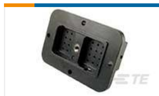
TE 产品编号DRC12-24PAE REC, 24P, BLK, E, FLANGE, A