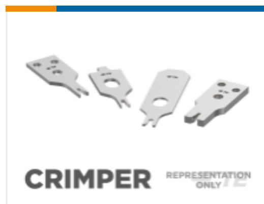
TE 产品编号5-1803223-0 CRIMPER, INSULATION F PREMIUM