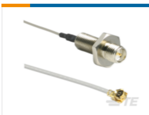
TE 产品编号CSI-RSFE-200-UFFR RP-SMA to U.FL/MHF1 200mm 1.13 OD