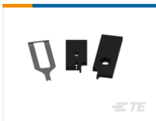
TE 产品编号2-2119791-2 DEPRESSOR, WIRE