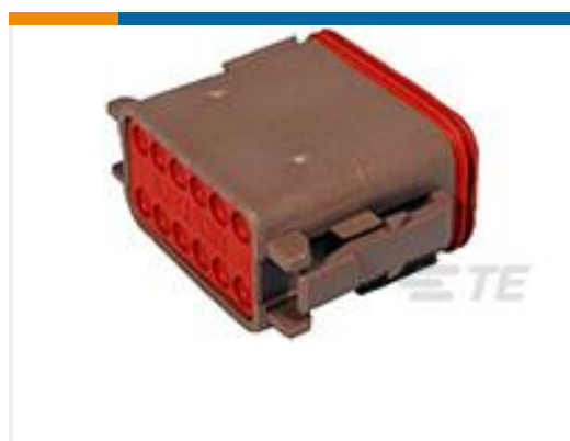
TE 产品编号DT06-12SD PLG, 12P, BRN, N, D